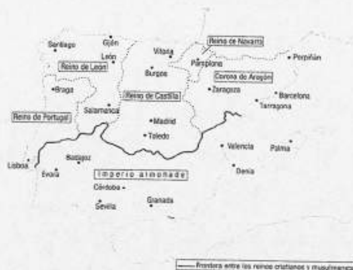
MAPA 4. La primera España: cinco reinos a mediados del siglo XII.

Significativamente, la palabra “español”, palabra de origen occitano, comenzó a usarse aplicada a los naturales de los reinos cristianos peninsulares a finales del siglo XI. La leyenda de la “pérdida de España” por don Rodrigo, el último rey godo –leyenda muy temprana que apareció por escrito en la llamada Crónica mozárabe de 754– constituyó uno de los ciclos más característicos de la poesía épica de los siglos XI y XII, y del romancero castellano (siglos XIV y XV). La misma “historia de España”, como algo distinto a las meras crónicas y anales de reyes y reinados, nació en el siglo XIII con el Chronicon Mundi (1236) de Lucas de Tuy, la Historia Gothica o De rebus Hispaniae (1243) de Rodrigo Jiménez de Rada y la Estoria de España de Alfonso X, completada entre 1271 y 1283 y escrita además ya en lengua vernácula. La “primera” España no surgió –conviene advertirlo ya– como una unidad, sino al contrario: constituyó una pluralidad de reinos (Castilla y León, unificados definitivamente en 1230; Navarra, nombre oficial del reino de Pamplona desde 1162 e independiente hasta 1512; Portugal, nacido como reino en 1139; y Aragón, o la corona de Aragón, creada en 1137 por la unión dinástica de la hija del rey de Aragón con el conde de Barcelona). El avance cristiano fue en todo momento paralelo al proceso de construcción de los reinos y enclaves cristianos, los citados, como monarquías territoriales estables y consolidadas, como estados “soberanos” propios y distintos.