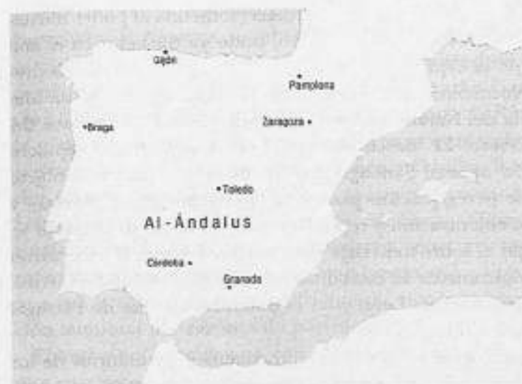
MAPA 1. Al-Ándalus en el año 732, en su época de máxima extensión.

Los primeros reinos y condados cristianos fueron, pues, núcleos de resistencia. Así, el pequeño territorio vascón de Pamplona, vertebrado en torno a la dinastía Arista, un reino independiente del control carolingio (como mostró el episodio de Roncesvalles, año 788, en el que los vascones aniquilaron la retaguardia de un ejército de Carlomagno que había entrado en la Península para estabilizar las fronteras del Ebro); y los condados aragoneses y catalanes, creación directa, como ha quedado dicho, del estado carolingio y reorganizados tras la desintegración de este en los condados de Aragón y de Barcelona (que con Borrell II, 947-992, englobó a todos los territorios de lo que desde el siglo XII se llamaría