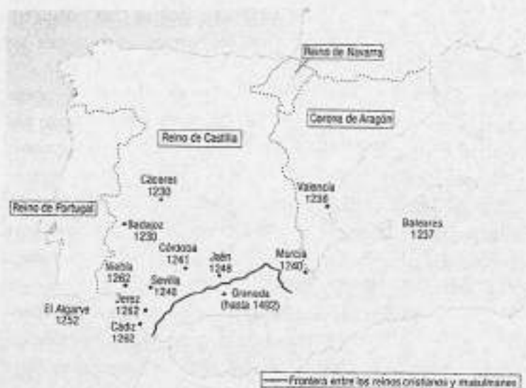
MAPA 6. El avance de la reconquista entre 1212 y 1270.

traron en profundidad en los reinos andalusíes del sur, llevó la frontera castellano-leonesa hasta las proximidades del Guadiana; Alfonso I de Portugal –nacido como “condado” en 1095 por cesión del rey castellano-leonés Alfonso VI y proclamado reino por Alfonso I Enríquez en 1139– tomó Lisboa en 1147; y Ramón Berenguer IV, que en 1137 unificó por vía matrimonial Aragón y Cataluña en la corona de Aragón, conquistó entre 1148 y 1160 Lérida, Tortosa, Fraga y otras plazas, y su hijo Alfonso II de Aragón, Teruel (1171) y tierras de su entorno, otro enclave estratégico decisivo. Los reinos cristianos pudieron ya delimitar, mediante tratados explícitos (Tudillén, Cazorla, Almisra) o acuerdos tácitos –o mediante el “de-