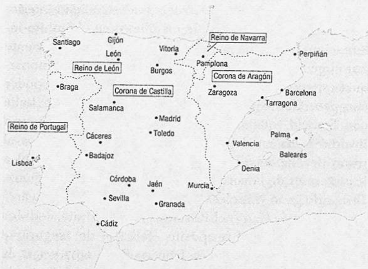
MAPA 7. La España de los Reyes Católicos.

De ahí los matrimonios de su hija la infanta Isabel con el rey de Portugal, Manuel (1495), y el doble enlace en 1496 de sus hijos Juana y Juan con los príncipes Felipe y Margarita, hijos del emperador y duque de Borgoña, Maximiliano I, cuyos dominios incluían las posesiones históricas de los Habsburgo en Austria, Hungría y Bohemia, más los Países Bajos, Luxemburgo, el Artois y el Franco Condado; de ahí también, el enlace de otra hija de los Reyes Católicos, Catalina, con Enrique VIII de Inglaterra (1509). Las consecuencias, imprevisibles sin duda para Fernando el Católico, iban a ser extraordinarias: nada menos que la aparición, a partir de 1519, de la España imperial.