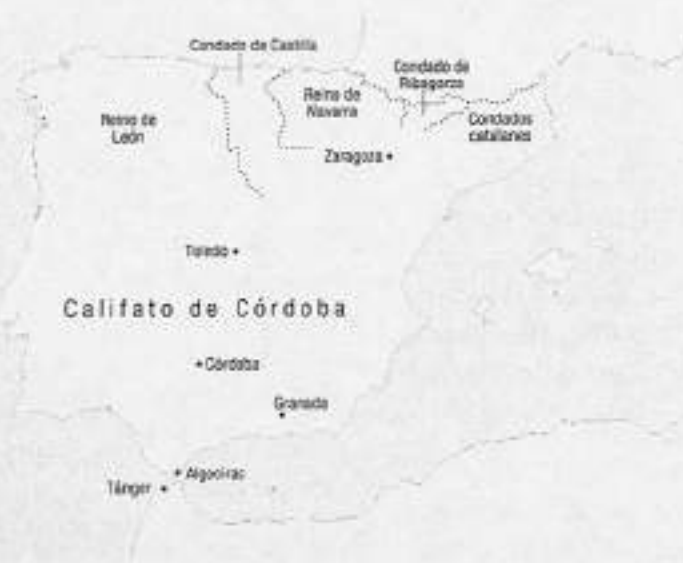
MAPA 2. Año 1000: reinos cristianos y califato de Córdoba.

califato de Córdoba, el gran estado en que desembocó, entre los años 929 y 1031, al-Ándalus, abarcaba unos 400.000 kilómetros cuadrados y su población estaba en torno a los tres millones de habitantes.