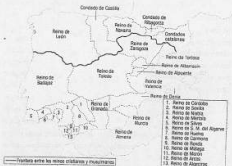
MAPA 3. Los reinos de taifas (año 1031).

Toledo, Albarracín, Valencia, Granada, Sevilla, Almería...), quedó a todos los efectos como un hecho definitivo. Esta es la conclusión esencial: no es que el avance cristiano provocara el desmembramiento del estado omeya cordobés, sino al revés: fue la desmembración del estado cordobés lo que posibilitó el avance cristiano.