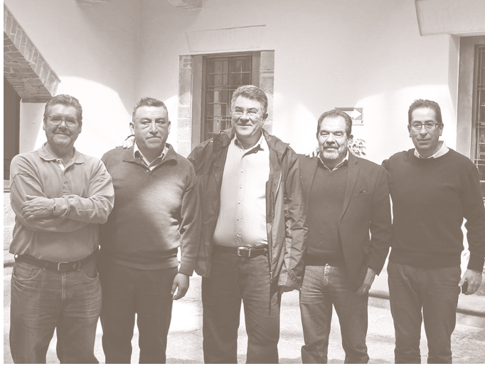
Con algunos amigos, en el Museo de la Memoria, ciudad de Tlaxcala. 2017

formación del ciudadano común que sigue teniendo una inclinación hacia la iglesia. Buscar las causas es complicado, tal vez nos limitamos a decir, “soy católico”, y no voy hablar mal de ellos, que hagan sus cosas. Creo que eso tiene más peso que lo que se tenga en la cuestión política.