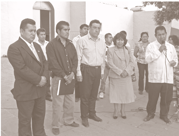
Durante emotiva ceremonia cívica, efectuada en el municipio de Contla de Juarez, Tlaxcala. 2011