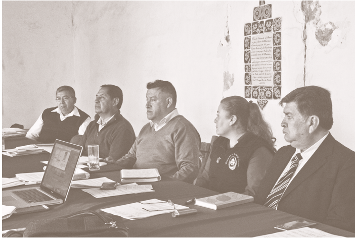
Reunión de Trabajo, comisión diocesana, Tlaxcala, 2017.

y que siempre fui vertical en ese sentido, por eso me prestó su material cuando yo lo requería.