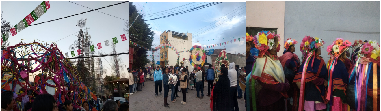
13. Los castillos, las coronas de palomitas de maíz y las pastoras.

Una vez que han llegan a la iglesia se coloca al santo patrono en el nicho, que lo adornara durante el tiempo de sagrado, se bendicen las coronas y se colocan en los castillos. Los castillos se encienden de forma tradicional por antigüedad, en comparación de otras secuencias de la formación en la entrada de castillo la familia Sánchez se coloca en el segundo lugar. Se cree, a demás, que si un castillo tiene problemas cuando se quema, hace mucho humo o se descontrola es porque no fue ofrendado con fe y devoción. Es un castillo, producto de problemas internos de la mayordomía correspondiente.