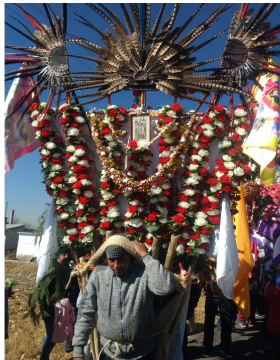
7. Cera grande con ornamento.