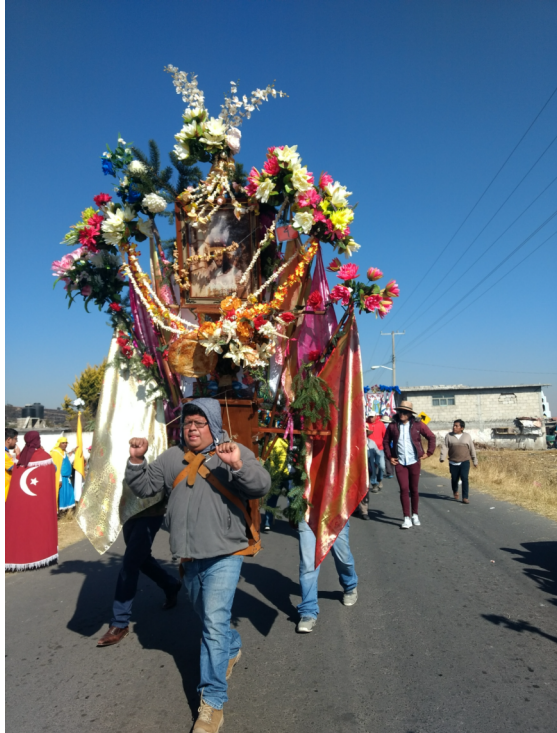
6. Cera grande con ornamento.