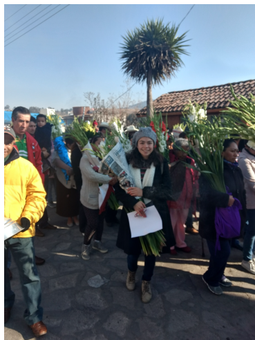
5. Entrega de Gladiolas.

La particularidad de la entrega de la flor es el corto tiempo en infringe la cotidianidad, sin embargo, significativamente es la única que florece al salir del sol. Es el preámbulo, es la flor que florece en la esperanza de quien se entrega. Años atrás, los campesinos tomaban las flores del campo, malvas, o siempre vivas. La flor representa la permanencia del estado material, desde que germina la semilla, crecen los pétalos o se marchita.