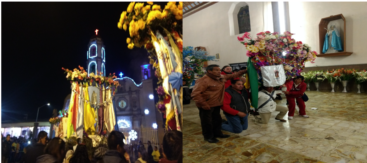
11. La llegada a San Felipe del Progreso y la presentación ante Nuestro Padre Jesús.

Cuando llega en padre, da la bienvenida a los peregrinos. En este momento se puede percibir la transición e impacto psicofisiológico de los peregrinos al cumplir su de una manda, plegaria, penitencia, u ofrenda. La entrada a la iglesia central es de alegría y gozo sin dejar a un lado el respeto y la devoción, algunos entran a la iglesia de rodillas soportando el peso de la cera. Aquí es donde se percibe con mayor claridad la entrega del terreno de los pensamientos. Acto de purificación.