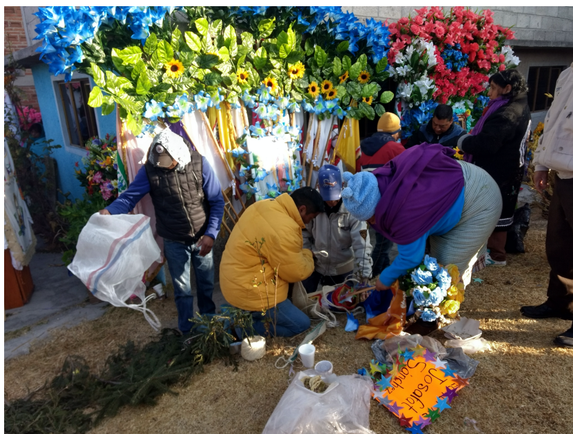
9. La decoración de la cera de la familia Sánchez.

La cera se coloca dentro de una caja de madera que tiene cintillos para ajustar a la espada y soporta el peso, pues además en la caja se ajustan palos de madera, con banderas 18 de colores amarrados a estos en forma de abanico, cada bandera simboliza a un integrante del grupo. Sobre las banderas se sostiene una imagen de Nuestro Padre Jesús, que puede ser bordada o impresa. El recorrido de la iglesia de Fátima a San Juan Jalpa, es el más grande que realizan.