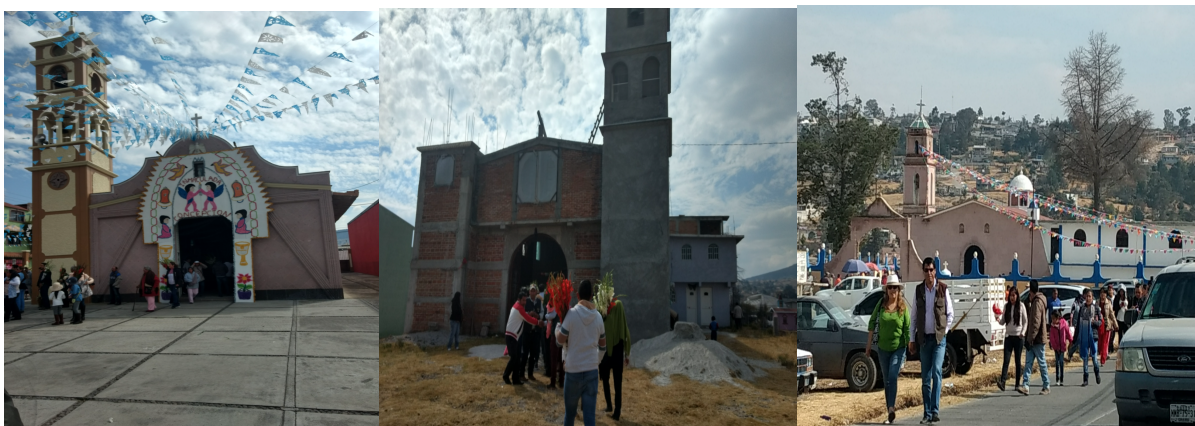
4, La Purísima Concepción, SanRamón y San Juan Jalpa.

Los ramos restantes serán dedicados a la iglesia que corresponda, según sea el orden en la procesión. El primero se queda en esa parroquia de San Felipe y Santiago (Santos patronales), posteriormente entregan en La purísima Concepción, después en San Ramón y por último en San Juan Jalpa. Cada que alguien llega a la iglesia se persigna a las cuatro direcciones cardinales, o cuatro elementos en el ramo de flores que será entregado en el recinto correspondiente.