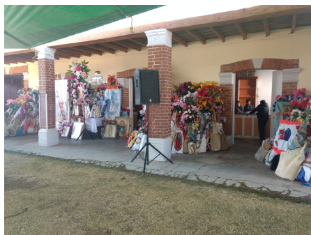
7. Tienda de raya en la estación de tren de Tepetitlán.

Se procede a retornar al origen, viajan de regreso en camiones hasta Tepetitlán 16 , cerca de las vías de tren el camión deja a los peregrinos, lugar donde son recibidos por grupos musicales, familiares y personas encomendadas para alimentarlos 17 . Antiguamente se ofrecía sende cho , una bebida de maíz germinado con pulque o zambumbia , bebida hecha de cebada tostada y molida. Una vez que han terminado de alimentarse se dirigen a San Martín Caballero, cantan o animan con leyendas como “Viva Nuestro Padre Jesús” “Vivan los mayordomos”, que hacen ameno el recorrido.