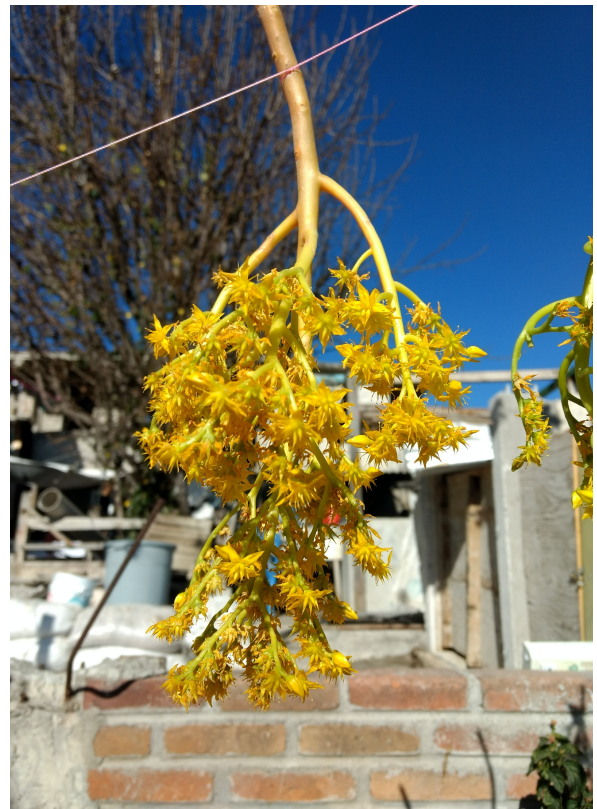
12. Sedum spathulifolium , comúnmente conocida como Siempreviva. Flor silvestre de la región.