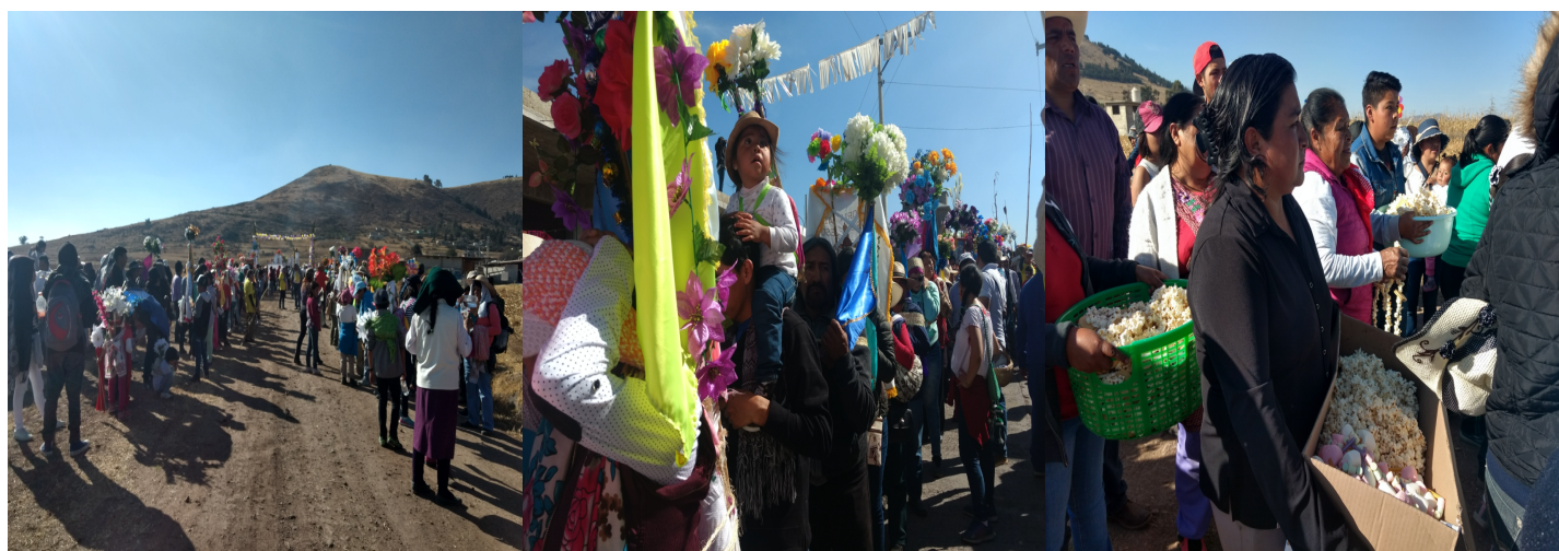
8. El portal de bienvenida, los niños presentes y la entrega de collares de palomitas de maíz.

Al entrar a dicha comunidad se vislumbra un arco de flores, rasgo característico de las entradas a espacios sagrados en tiempos míticos, son recibidos con coronas de palomitas de maíz o collares con pan que les son colocadas a las ceras que llegan. La organización de la peregrinación es la siguiente, al frente va la imagen de la Virgen de Guadalupe, quien ha guiado el camino de todos ellos, posteriormente los estandartes con imágenes de Nuestro Padre Jesús, y al final las ceras, primero las pequeñas, que entregan niños o jóvenes, después las ceras grandes que ofrendan los mayordomos.