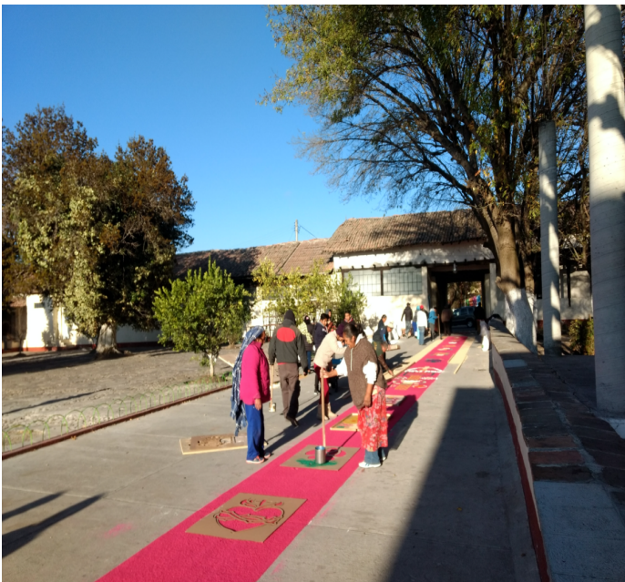
11. Tapete de asarrín, originario de Puebla. Ofrenda a Nuestro Padre Jesúa, el día de su cambio de vestimenta.