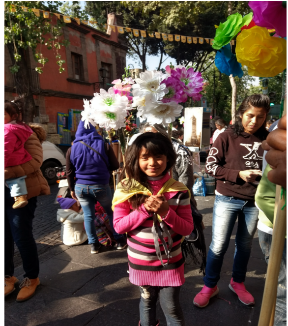
3. Participación de los niños en las tradiciones de la comunidad de San Felipe del Progreso.