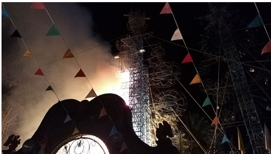
14. La quema de castillos.

La interacción del creyente con el santo es de profundo respeto, idealmente todo aquello relacionando con su vestimenta, tiene valor místico y curativo, por ello cuando entran a la casa del señor, suelen dirigirse a el besarlo, o a acariciarse la piel normalmente con el cordón que le rodea la cintura, como esperando vivificarse con el primer contacto deseado, también suelen persignarse con el cordón, se bendicen en el nombre del señor, aludiendo a la santa cruz. A cambio del permiso dejan algunos centavos.