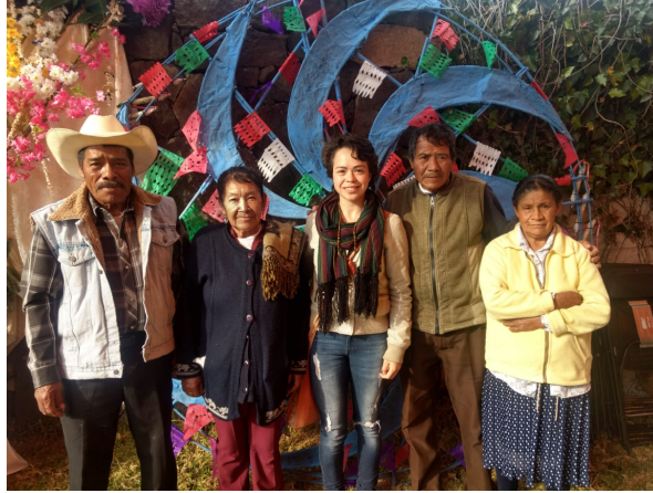
12. La decoración de la corona del castillo.

Como es costumbre y ya se ha mencionado se colocan por orden de antigüedad respetando los lugares de las familias que dieron inicio a estas tradiciones. A demás se suman los peregrinos y mayordomos del nicho, las estrellas y los danzantes de ofrendan a Nuestro Padre Jesús .