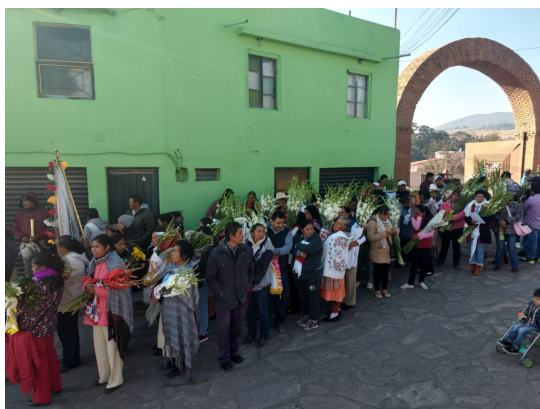
2. Reunión en el Tunal para la entrega de la flor.

Cada mayordomo reúne a su grupo de integrantes para ofrendar las flores a la imagen. Salen antes del salir el sol, aproximadamente a partir de las cinco de la mañana, inician los juegos pirotécnicos, quien apadrina el castillo alberga al mayordomo, pues de su hogar parten, y hacen el recorrido a las casas de los demás integrantes del grupo con el fin de que se vayan sumando. Van recolectando creyentes.