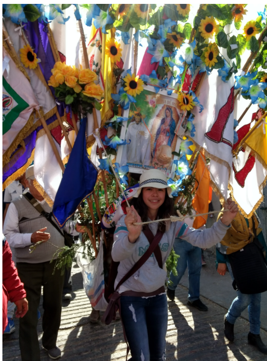
10. La cera camino a San Felipe del Progreso.

El sol apenas alumbrá las fachadas de las casas, delinea con luz la orilla de los montes, los peregrinos se dirigen a San Juan Jalpa para agradecer y celebrar la misa que dará comienzo a la entrada del bulto o fuego sagrado, luz de su fe. Después parten a la parroquia, en el camino se acercan amigos o compadres que no tuvieron la oportunidad de asistirlos durante la peregrinación y solicitan el permiso para cargar la santa cera.