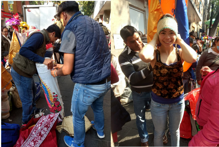
6. Primer ornamento y carga de la cera a la Basílica de Guadalupe.

Cuando un integrante cumple determinado periodo de mayordomía se realiza una ceremonia conmemorativa por su constancia, se le corona con flores y se le cuelga alrededor del cuello un collar que lleva un pan. Esto se realiza en el trayecto de la calzada a la Basílica, donde se cumple el primer transito sagrado, su presentación social y celebración por su devoción. Ellos nos guían, nos representan y se asumen hombres sabios, hombres de bien.