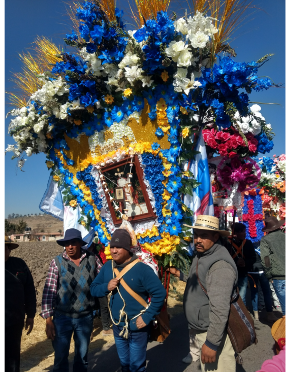
5. Cera grande con ornamento.