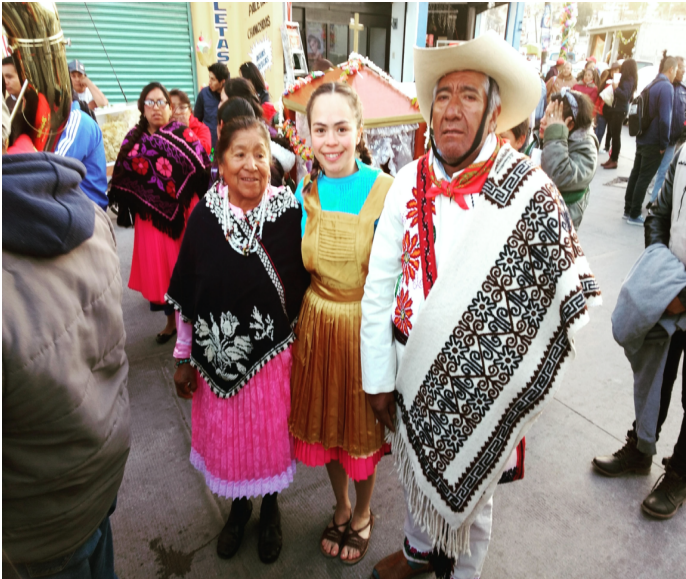
9. Vestimenta típica de la región de San Felipe del Progreso. Zona Jñatjro.