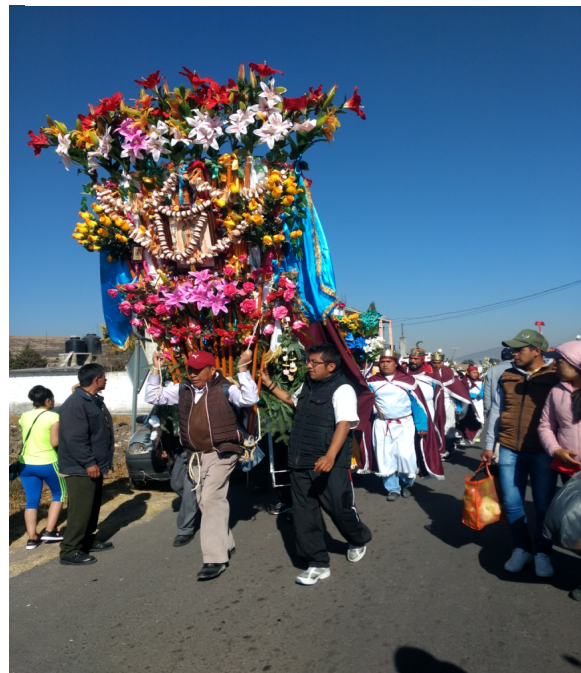
1. Cera grande con ornamento.