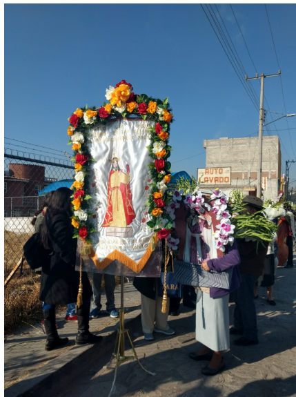
3. Estandartes principales de los peregrinos.

Todo camino al que se dirigen a lo largo del día, van guiados por estandartes con la imagen de Nuestro Padre Jesús y la Virgen María , algunos llevan escrita la leyenda “Viva Jesús”. Se acompañan de canticos católicos, o expresiones imperativas, por ejemplo “ Viva Nuestro Padre Jesús ”, “ Viva la Virgen María ”, “ Vivan los mayordomos ”, “ Viva San Felipe del Progreso ”. Los cohetes avisan su caminar. En el recorrido llevan copal para bendecir, a demás de flores en vueltas en servilletas bordadas con imágenes sagradas, que serán ofrendadas en los distintos recintos de la pequeña caminata.