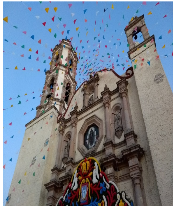
10. Adornos en la iglesia del pueblo.