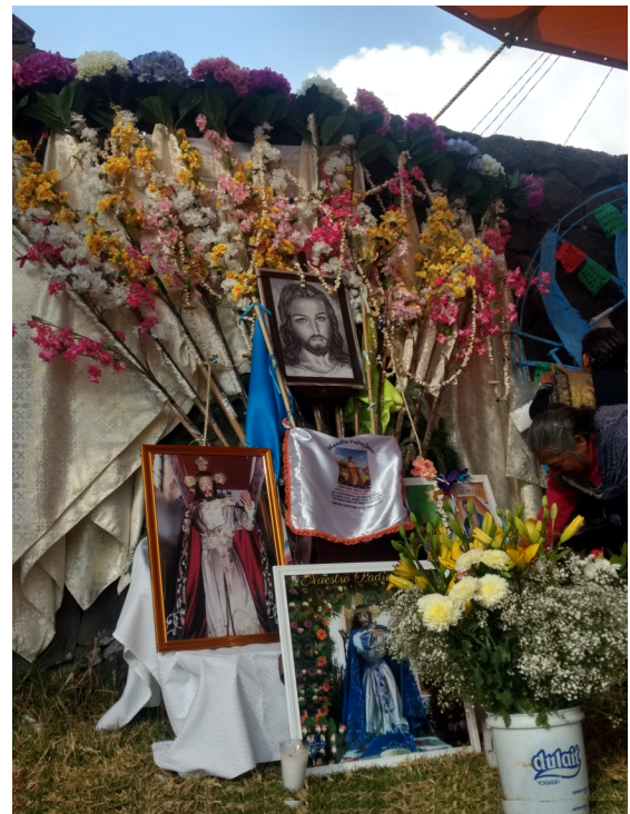
8. Reposo de la cera el día de la entrada del Castillo.