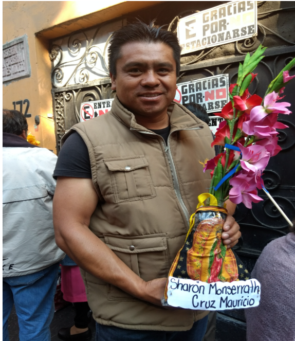
2. Primer adorno de la cera.