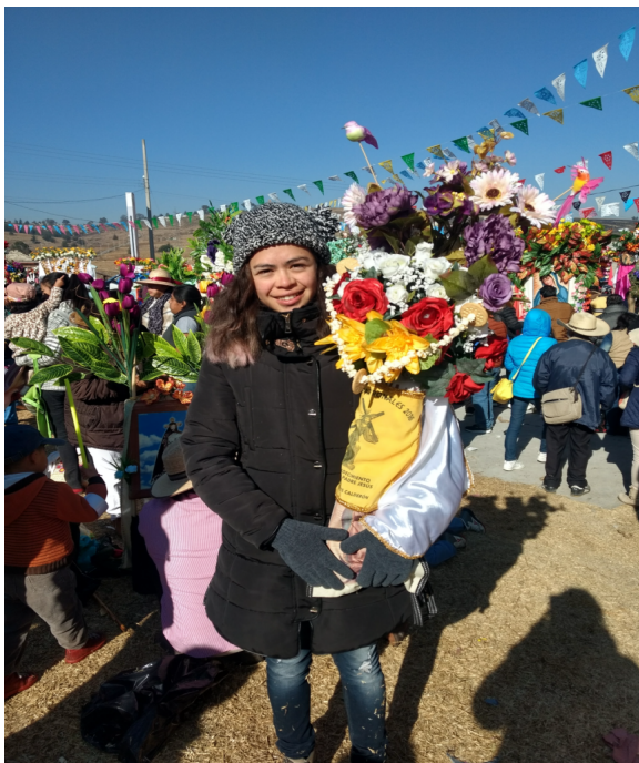
4. Cera pequeña con ornamento sencillo.