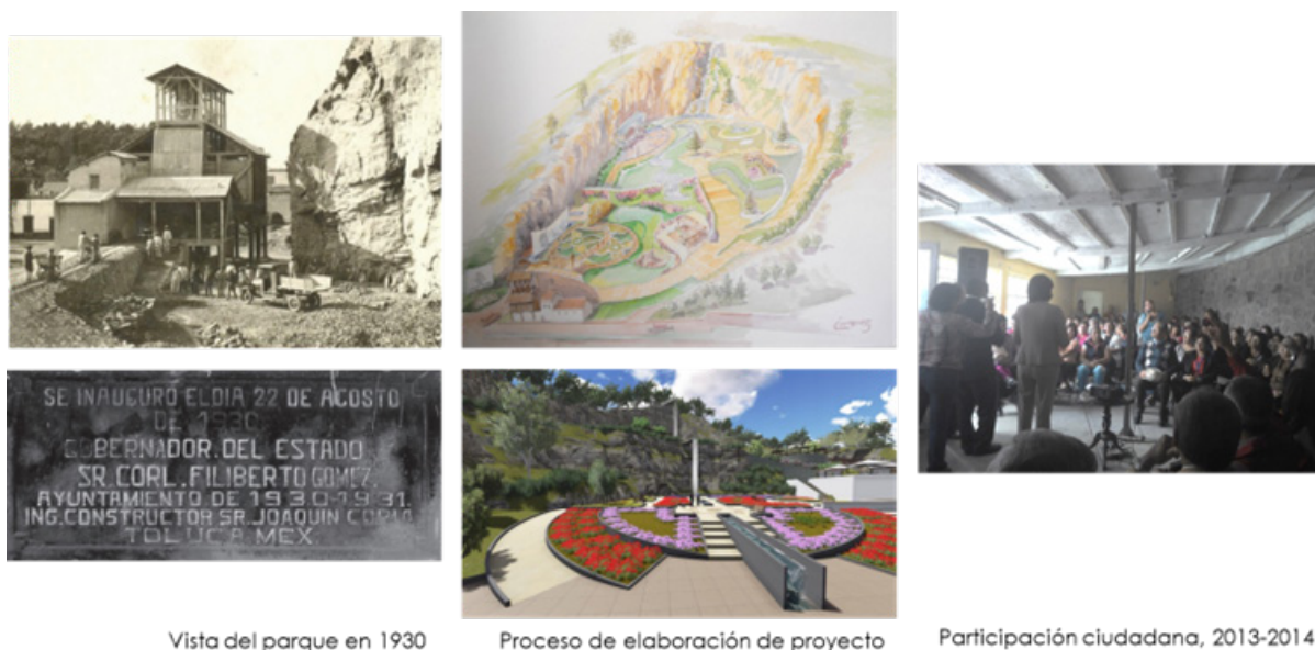
Figura 2. Etapas de proyecto. Traversalidad de acciones: IMPLAN

En el Estado de México, el IMPLAN Toluca fue pionero, al consolidarse como organismo técnico