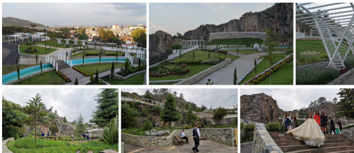
Figura 3. Vistas de "La Pedrera 2021"

Del análisis de la experiencia del IMPLAN Toluca, se resalta el papel estratégico de los IMPLANES en las acciones, planes y proyectos enfocados en la mejora de la habitabilidad urbana; este último, de acuerdo con Páramo (2018), es un tema poco explorado en la academia mexicana, y en el cual es el espacio público el elemento heterogéneo vertebrador de calidad urbana, al funcionar como escenario de realización de valores en colectivo fundamentales para la convivencia humana y el fortalecimiento del tejido urbano y social. De acuerdo con el numeral 53 de la Nueva Agenda Urbana (2015, p.19) es un componente fundamental de una ciudad sostenible, toda vez que tiene un impacto positivo en materia económica, social y medio ambiental. Es decir, el espacio público es una oportunidad de transformación y desarrollo hacia mejores condiciones de habitabilidad urbana.