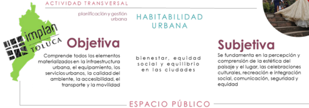
Figura 4. Actividad transversal del IMPLAN en la construcción de habitabilidad urbana

Con base en lo anterior, y de acuerdo con el planteamiento de Saldarriaga (1981) y Castro (1999) referente a la habitabilidad, comprendida como el conjunto de condiciones físicas —objetivas— y no físicas —subjetivas— que permiten la permanencia humana en un lugar, y en un grado mayor o menor, la gratificación de la existencia, la materialización de La Pedrera se consolida como un espacio público que contribuye al mejoramiento de la habitabilidad, en tanto se observa el bien estar, el bien haber y el bien ser, aspectos asociados a lo cognitivo, lo afectivo, lo funcional y lo satisfactorio, entrelazados por el sentido de apropiación y transformación del espacio vivido (Figura 4).