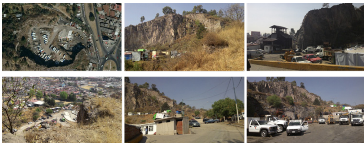
Figura 1. Vistas de La Pedrera en 2013

Como parte de las atribuciones del IMPLAN Toluca, se identificó un predio de 4.88 hectáreas que forma parte del parque estatal Sierra Morelos, declarado Zona Natural Protegida por el Gobierno del Estado de México, el cual, de 1930 a 1970, operó como mina de extracción de material pétreo para consumo