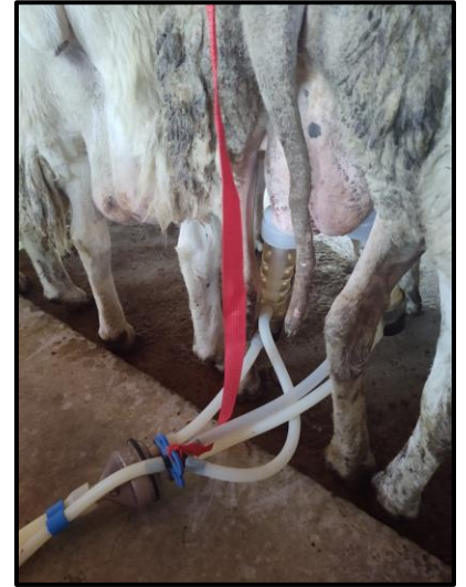
Ilustración 4: Ordeña mecánica

Las ovejas fueron secadas cuando la producción total de leche se observen rendimientos por debajo de 150 ml, de acuerdo con las normas internacionales para el registro de la leche en ovejas (ICAR, 1992). La producción total de leche y el rendimiento total de grasa y proteína se estimarán según Thomas et al. (2001).