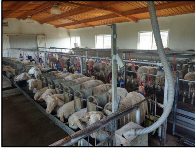
Ilustración 1: Sala de ordeño mecánica de tipo paralelo. Rancho San Francisco, municipio de Colón, Estado de Querétaro