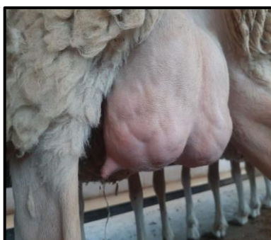
Ilustración 6: Limpieza y desinfectado de pezones.