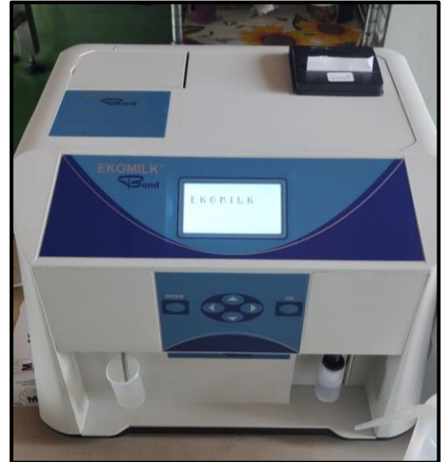
Ilustración 2: Analizador de leche Economilk Bond Total 40s