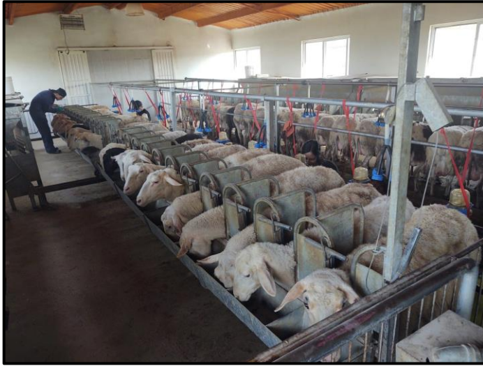
Ilustración 3: Preparación e identificación de las ovejas previo inicio de la ordeña.