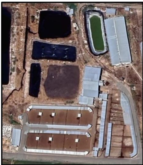
Ilustración 8: Vista panorámica del Rancho San Francisco, municipio de Colón, Estado de Querétaro

con una probabilidad de más del 27 % de que cierto día será un día mojado. El mes con más días mojados en Colón es julio, con un promedio de 14.9 días con por lo menos 1 milímetro de precipitación. La temporada más seca dura 8.0 meses, del 4 de octubre al 2 de junio. El suelo es de tipo volcánico, habiendo tepetate, obsidiana, basalto en las zonas altas, grandes variedades de ópalo y vetas de diferentes minerales.