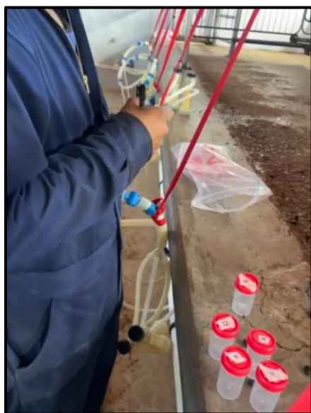
Ilustración 5: Etiquetado del recipiente vaso estéril para toma de muestra.