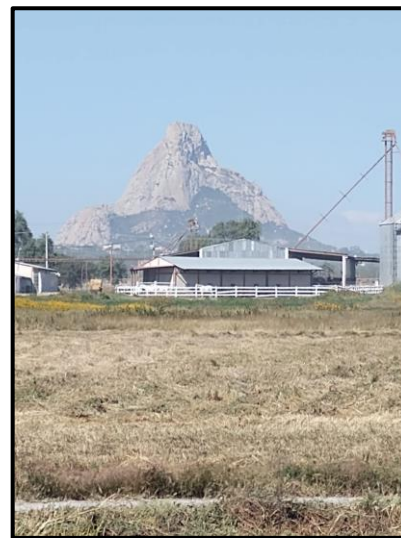
Ilustración 9: Vista al monolito Peña de Bernal desde el Rancho San Francisco, municipio de Colón Estado de Querétaro.