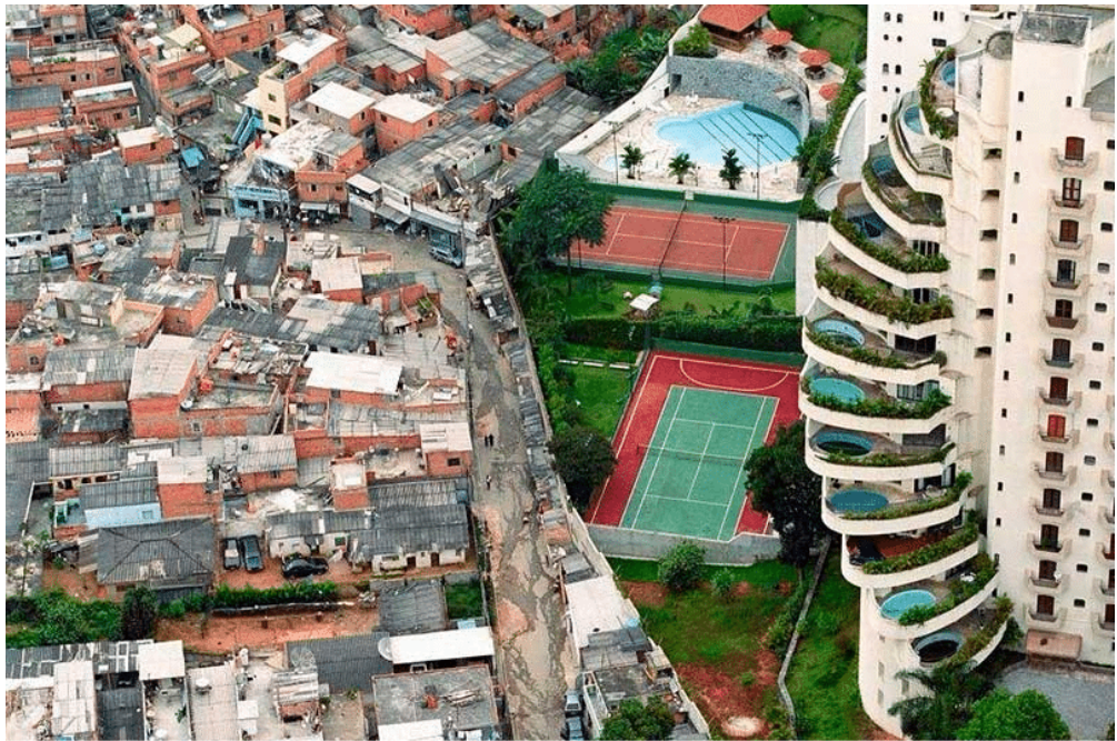
Fotografía 1. Arquitectura desigual (2021).

A pesar de tales contrastes, ambas realidades materiales, sociales y culturales muchas veces viven en total colindancia, con un muro infranqueable como frontera. Es donde la desigualdad se hace muy notoria y difícil de ignorar. Sin embargo, más allá de lo urbano y arquitectónico, en las manifestaciones, objetos, usos y bondades del diseño, tanto industrial como gráfico, ocurre la misma tendencia al ser complementos necesarios del entorno construido.