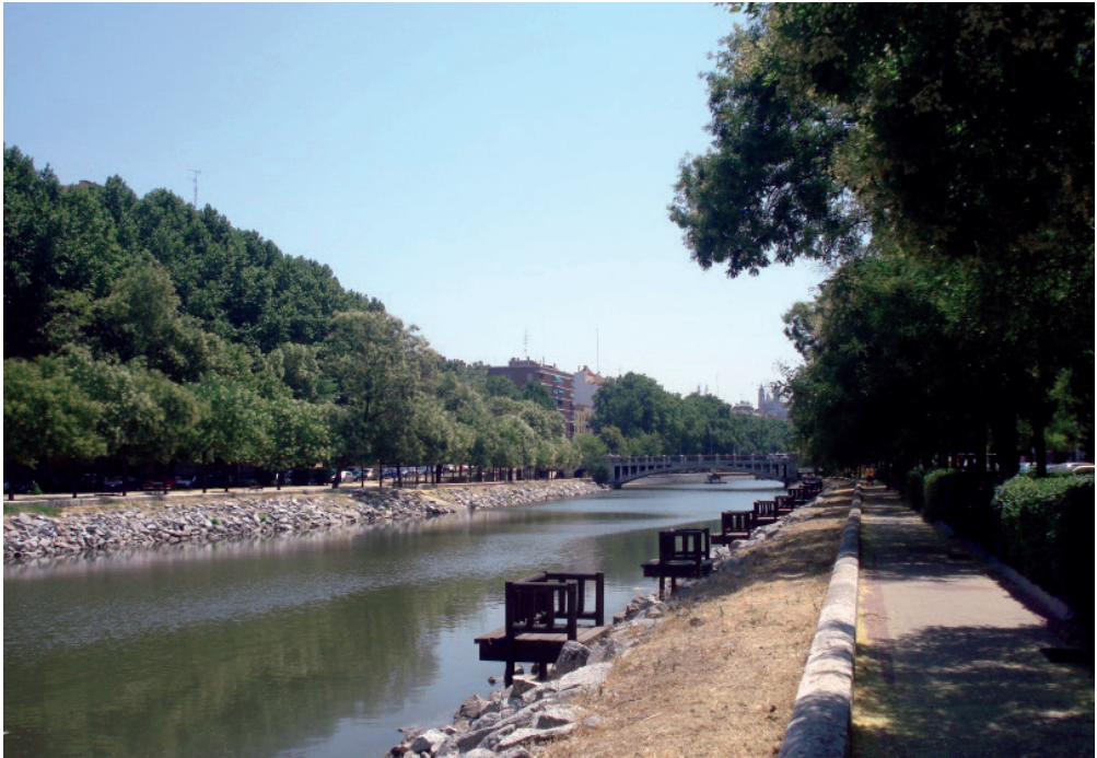
Fotografía 1. Río Manzanares, Madrid. Autor, 2015.

Por otra parte, tenemos al Parque Madrid Río ubicado a la orilla del río Manzanares, se inauguró en el año 2011. El parque se volvió un lugar atractivo al ser el nuevo pulmón verde de la ciudad (ver foto 1), por su propuesta de paisaje, la implementación de nuevos puentes que conectan el centro de Madrid con los otros barrios, juegos, espacios de descanso, entre otras actividades. Con la creación de esta obra, la ciudad ganó un espacio verde de calidad, se recuperó el río y este lugar dejó de ser una barrera. A la par de la creación del proyecto, se comenzaron a realizar obras de orden público y privado, el cierre de establecimientos locales como la panadería del barrio, la barbería que se convirtió en un café hípster o un bar de cereales, un local vacío se convirtió en hostel , un edificio abandonado que utilizaban las personas sin hogar fue derrumbado y se construyó un edificio de departamentos de lujo (Pérez, 2020).