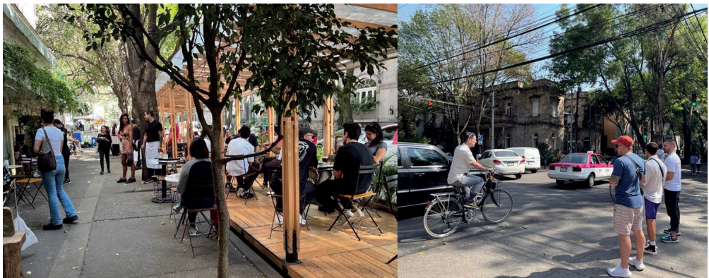
Fotografía 2. Nómadas digitales en cafetería y calle Orizaba en la Colonia Roma.

Los nómadas digitales llegan a vivir a una zona en específico, a los barrios Condesa y Roma, cuyos exuberantes paisajes urbanos, con arquitectura Art Deco y Art Nouveau, con una propuesta gastronómica gourmet, establecimientos elitizados, los han hecho atractivos durante mucho tiempo para los residentes más adinerados (Shortell, 2022). Con esta nueva dinámica también han proliferado los cafés que son lugares de trabajo remoto en donde se puede ver a extranjeros (ver foto 2).