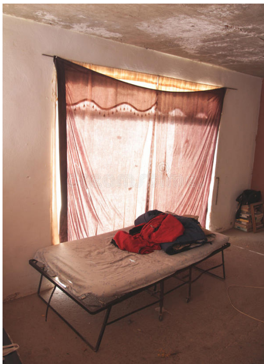
Fotografía 2. Pobreza habitacional (2019)