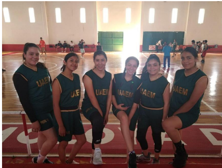
Fig.4. Participación en mañanas deportivas. (09 octubre de 2019, Unidad Deportiva Profesor “Enrique Millán Flores” Almoloya de Alquisiras)

Así mismo la comunidad da respuesta a las invitaciones a eventos deportivos y culturales en donde los alumnos con orgullo representaron al plantel joven ubicado en el sur del Estado de México.