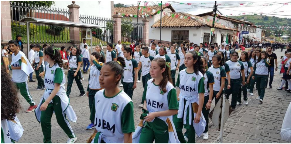
Fig.3. Participación de la comunidad estudiantil y docente en el desfile conmemorativo al Día de la Independencia en México. (16 septiembre de 2019, Almoloya de Alquisiras)

2021) se participó en eventos cívicos como lo son desfiles alusivos al 16 de septiembre y 20 de noviembre.