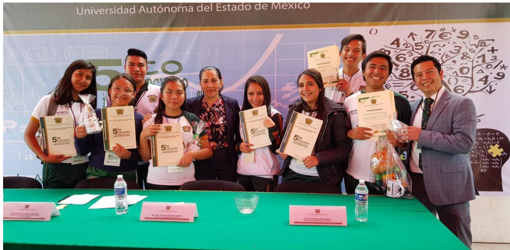
Fig.5. Plantel “Mtro. José Ignacio Pichardo Pagaza” sede del 5to Concurso Interpreparatoriano de Matemáticas (26 de noviembre de 2019, Almoloya de Alquisiras)