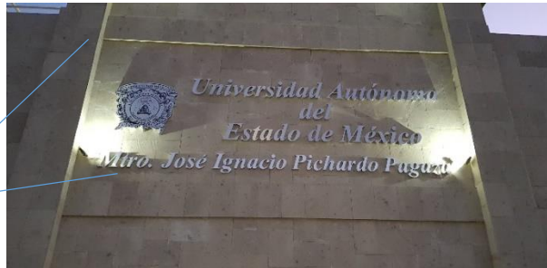
Pórtico de entrada al Plantel “Mtro. José Ignacio Pichardo Pagaza” de la Escuela Preparatoria

Durante los primeros dos años de actividades académicas ya como un plantel de la Escuela Preparatoria (agosto 2017-agosto 2019) las clases se iniciaron en la Universidad Mexiquense del Bicentenario de Almoloya de Alquisiras ubicado en Agua Fría, comunidad aledaña al centro del municipio. Así inició el plantel su historia académica, no fue hasta febrero de 2019 cuando se hace entrega del edificio en el que hasta entonces se tienen clases presenciales.