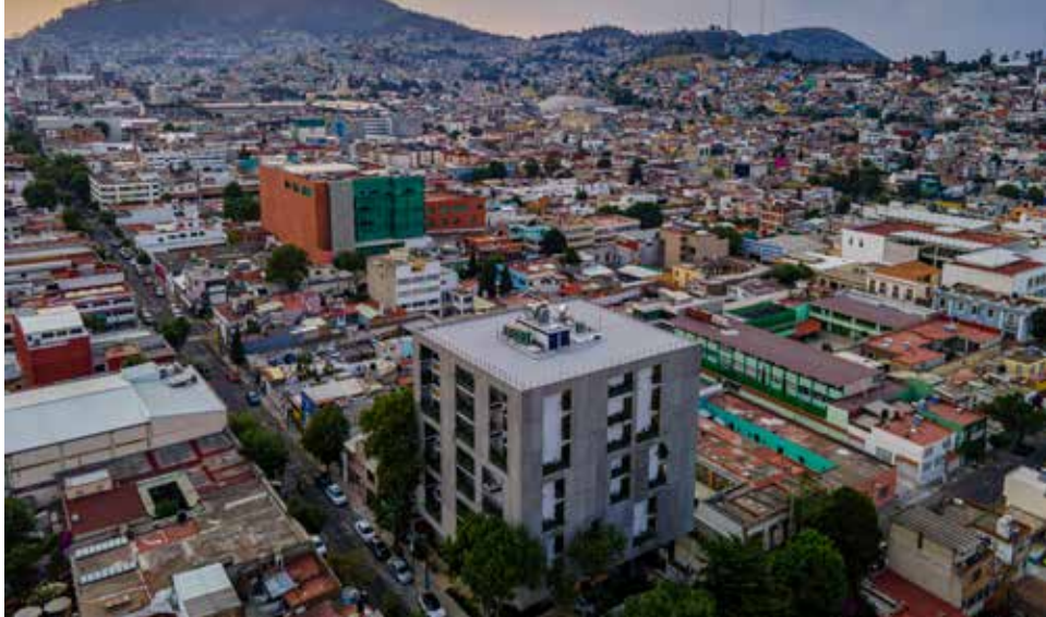
Edificio UAEMITAS