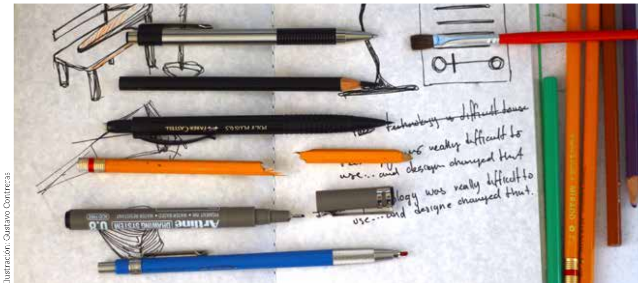
Ilustración: Gustavo Contreras

Educación, educación, educación... tema del que se ha escrito mucho y se avanza tan poco por lo menos en el caso de nuestro país, ya sea por falta de creatividad, de voluntad académica y política, de capital económico y humano, o tal vez un poco de todo aunado a la falta de coordinación y consensos que permitan generar cambios más allá del discurso, es decir, en la cada vez más difícil, intempestiva y terca realidad.