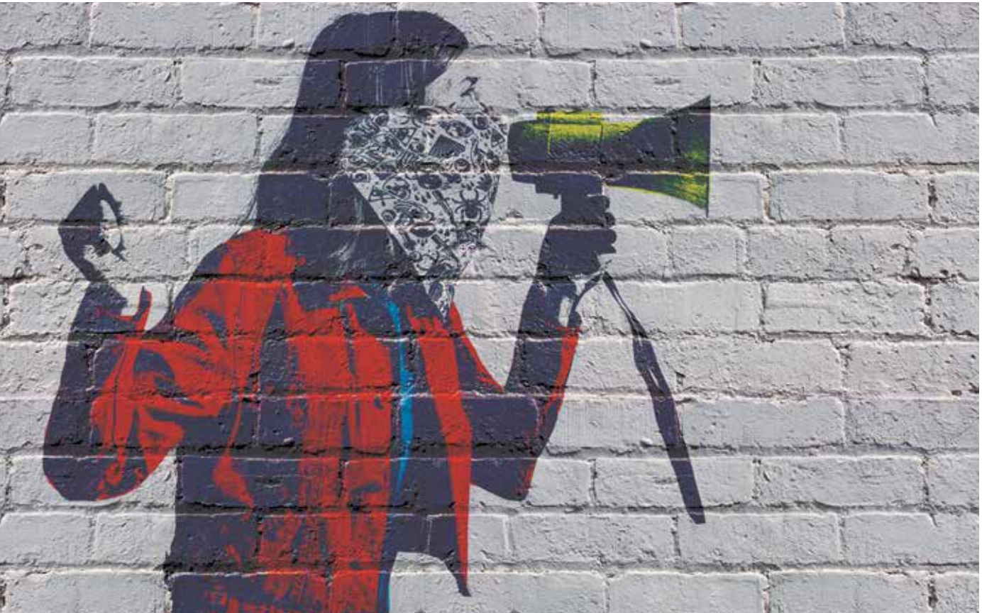
Ilustración: Gerardo Mercado

Pensar en la universidad evoca un espacio de enseñanza y de aprendizaje que tiene como uno de sus principales objetivos contribuir a la formación de ciudadanas y ciudadanos que entiendan su papel en sociedad y se comprometan con esta desde cualquier disciplina de estudio. La universidad es el lugar donde se cultiva el conocimiento, pieza fundamental de su existencia y de su razón de ser.