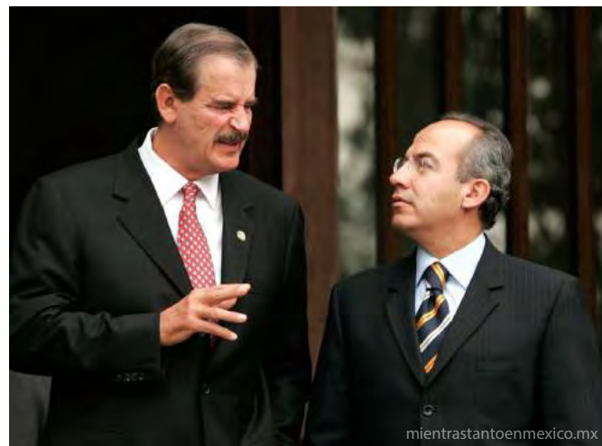
Ex presidentes Vicente Fox Quesada y Felipe Calderón Hinojosa.

La emoción por parte de la sociedad ante el triunfo del Partido Acción Nacional era más que evidente, la sociedad del año 2000 estaba en busca de un cambio que iba más allá de un color de partido, el ánimo en que las cosas podían cambiar de manera sustancial permeaba en el imaginario colectivo, sin embargo, lamentablemente este añorado cambio no logró materializarse a lo largo de un primer periodo sexenal, que tal como se mencionó anteriormente, desilusionó a aquellos que decidieron dar su voto a un partido político distinto al acostumbrado.