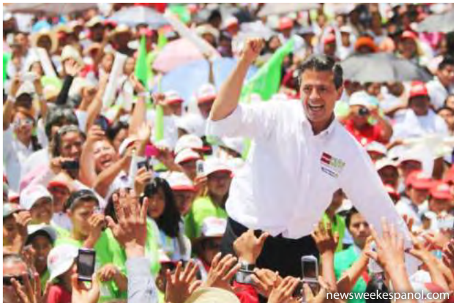
Cierre de campaña del candidato Enrique Peña Nieto.

El regreso del PRI parecía más que predecible, desde el inicio de su campaña, Peña Nieto lideró las preferencias con una intención de voto de entre 39 y 54 por ciento y durante semanas se lo vislumbró como seguro ganador. Su candidatura se apoyó en su imagen personal (construida seis años como Gobernador del Estado de México –2005 a 2011– con el apoyo de una poderosa maquinaria mediática) y en las estructuras territoriales y clientelares del PRI (Olmeda, 2013).