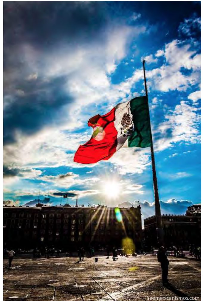
Zócalo de la Ciudad de México

La suma de voluntades y la toma de conciencia sobre el papel de cada ciudadano es lo que hará que esto se convierta realmente en una añorada transformación.