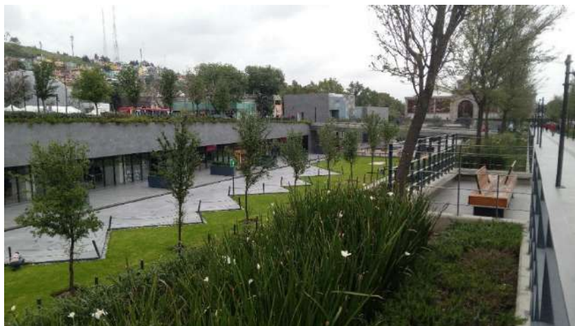
Figura 4. Diseño urbano, 2024