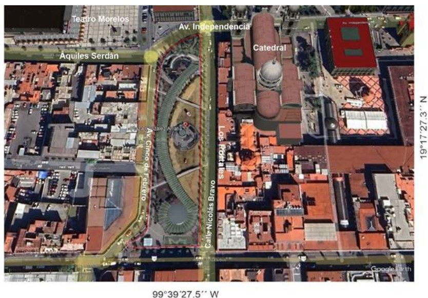
Figura 7. Plaza González Arratia