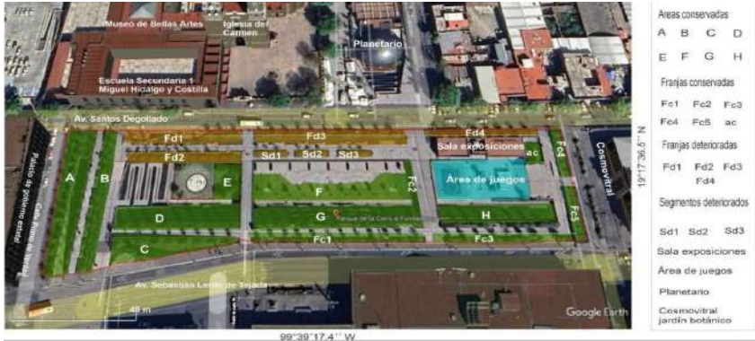
Figura 5. Parque de la Ciencia Fundadores. Estado de la vegetación