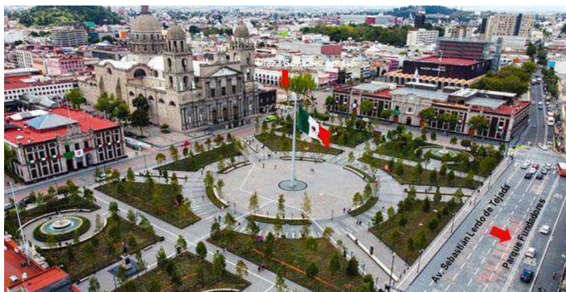
Figura 9. Plaza de los Mártires, 2024