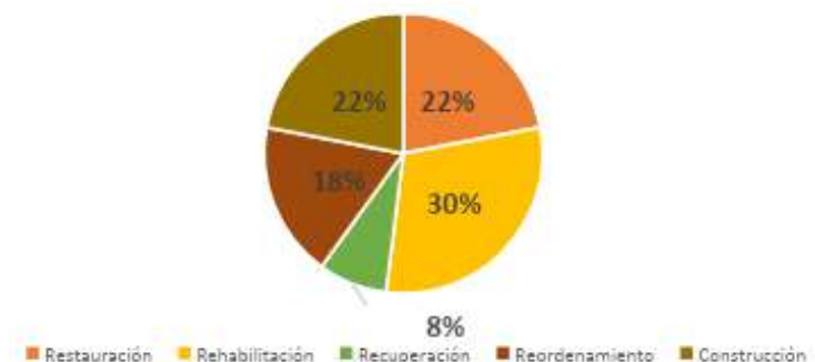
Figura 2. Centro de Toluca: Tipos de intervención urbanística, 2000-2018.

Fuente. Elaboración propia con base en la información de documentos oficiales 2018-2024