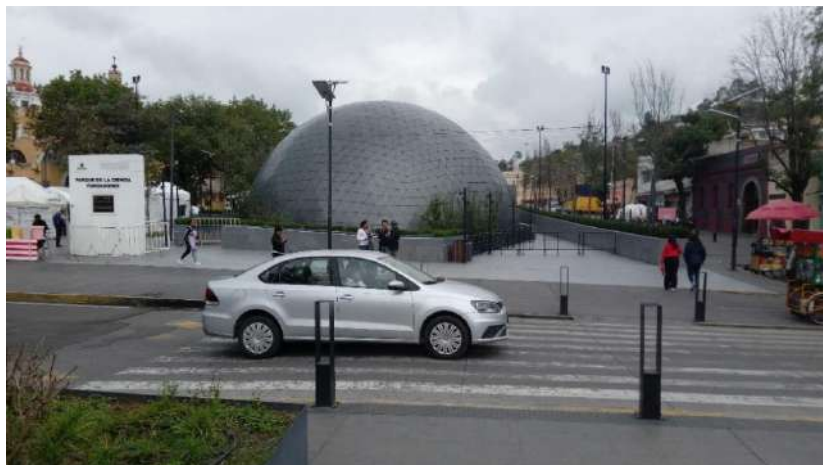
Figura 6. La modernidad del planetario, 2024