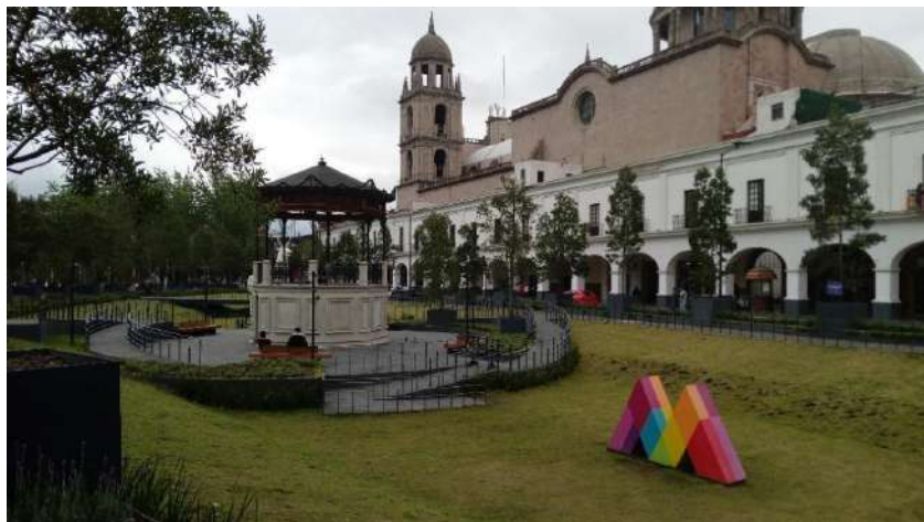
Figura 8. El Kiosco y los portales reminiscencia del pasado, 2024