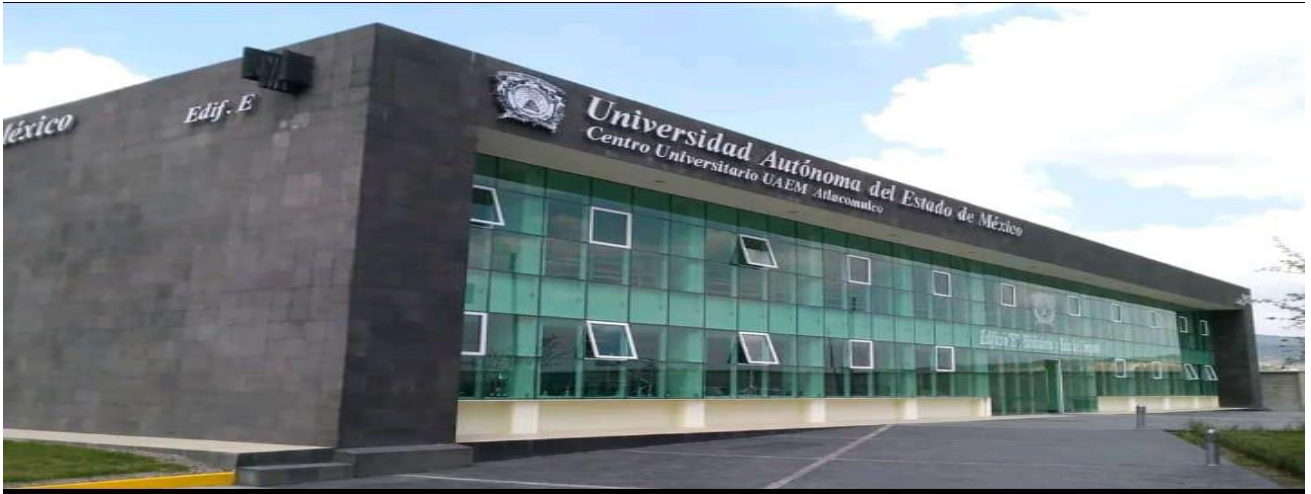
Imagen. Fotografía institucional icono de la administración 2021-2025. CU UAEM Atlacomulco. 2025.