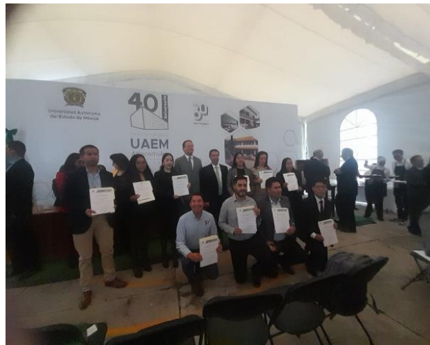
Imágenes. Reconocimientos al personal y egresados en la Ceremonia del XL Aniversario del Centro Universitario. 17 de septiembre de 2024. CU UAEM Atlacomulco.2024.