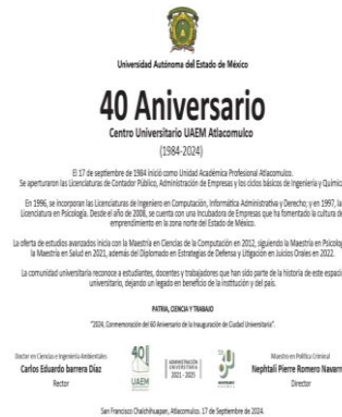
Imagen. Placa conmemorativa que inserta el devenir de los años en reconocimiento del XL Aniversario del Centro Universitario. 17 de septiembre de 2024. CU UAEM Atlacomulco. 2024