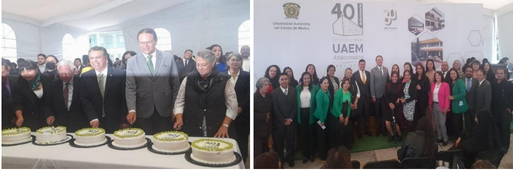
Imagen. Degustación conmemorativa ofertada por la anfitriona de la comunidad universitaria al XL Aniversario del Centro Universitario. 17 de septiembre de 2024. CU UAEM Atlacomulco. 2024

Iniciando el memorable XL Aniversario del CU UAEM Atlacomulco. Además, se sobresale en el ocaso del evento, que a partir de ahora se emprenden algunas actividades que resalten dicha celebración: Hacer saber que el memorable XL Aniversario del CU UAEM Atlacomulco será durante el ciclo escolar 2024-2025.