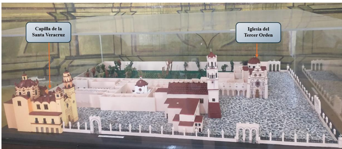
Imagen 2: Maqueta del Convento Franciscano de Toluca, Toluca, tomada el: 22/03/24.

Así mismo, las sesiones celebradas por la Conferencia iniciaban con un el rezo y la lectura del Reglamento,