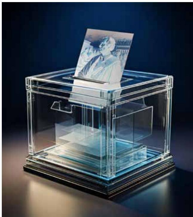
Ilustración: Gustavo Contreras

Un siglo después se dio la confrontación con los regímenes autoritarios. La Segunda Guerra Mundial evidenció la necesidad de defender la