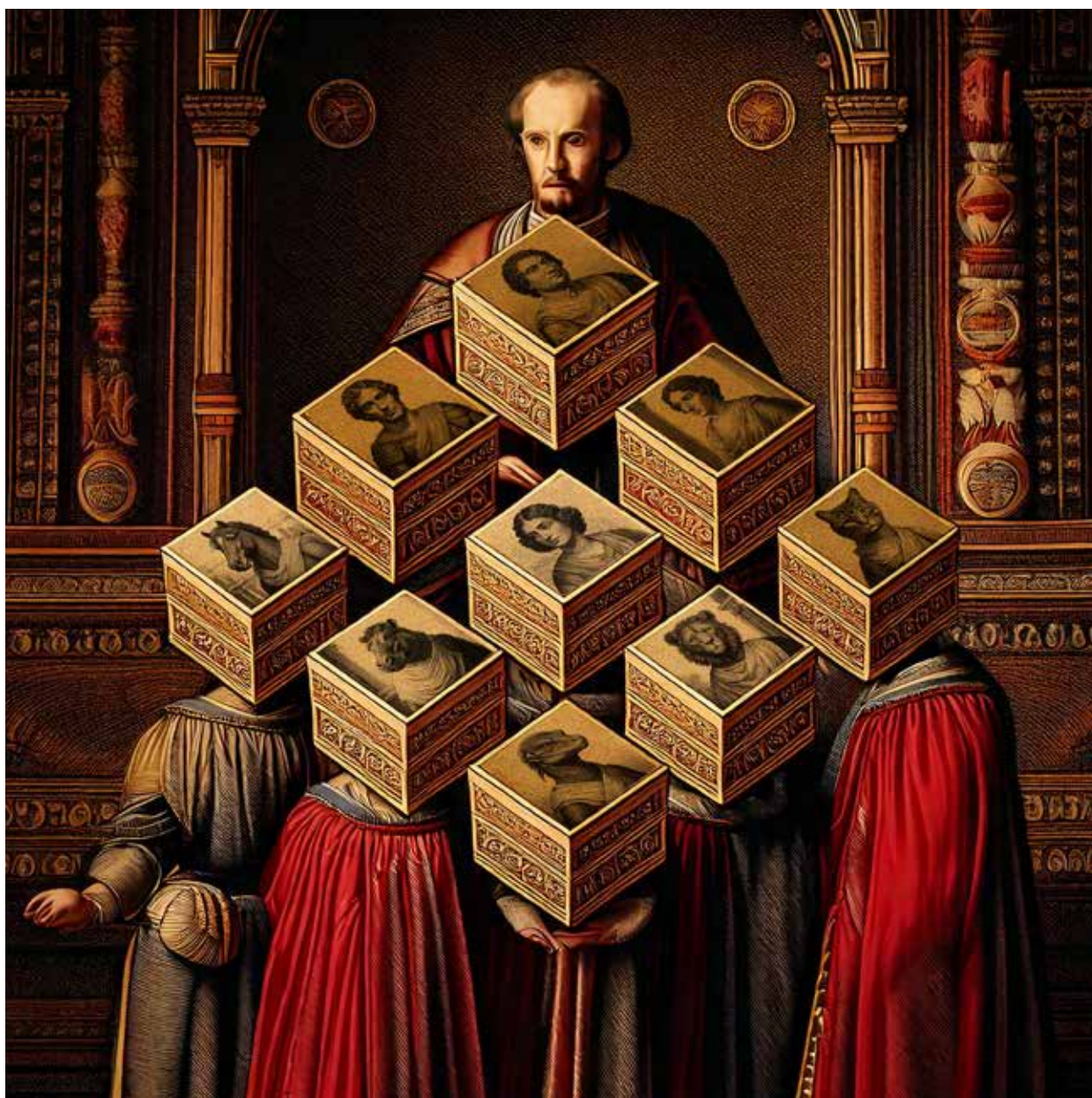
Ilustración: Gustavo Contreras