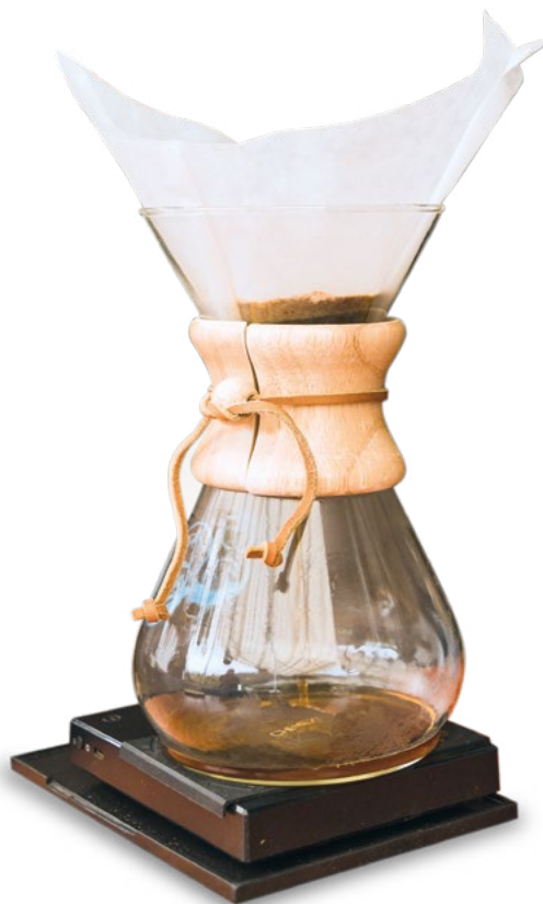
▲ Cafetera chemex .

Por otro lado, acostumbrados a recibir visitantes, la hospitalidad malinalquense es un valor fundamental en las casas. Ofrecer café a quien llega es una muestra de esta cortesía. El gesto simboliza la bienvenida y el deseo de compartir un momento de calidez y conexión. El café se convierte en un puente cultural que refuerza las relaciones interpersonales y mantiene viva la tradición de hospitalidad.