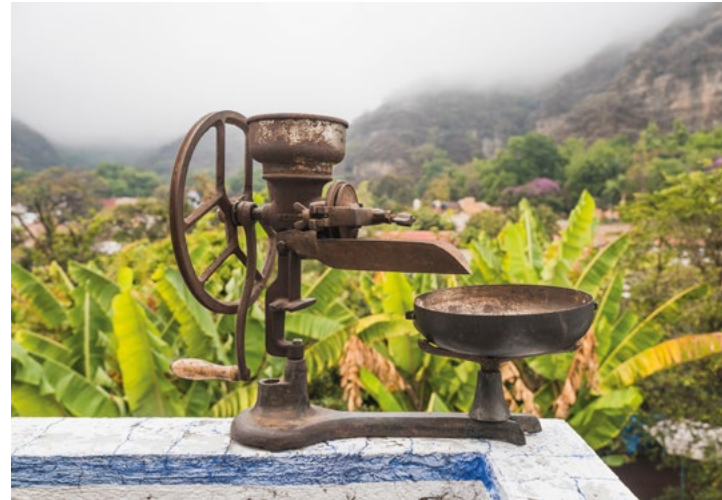
▲ Molinillo de café manual.

Mediante este proceso el grano se fragmenta y se convierte en polvo listo para preparar una deliciosa bebida. El uso de molinos de café manuales o de nixtamal refleja la adaptación de las prácticas locales a las necesidades y recursos disponibles en la comunidad. Aunque este método puede requerir más esfuerzo y