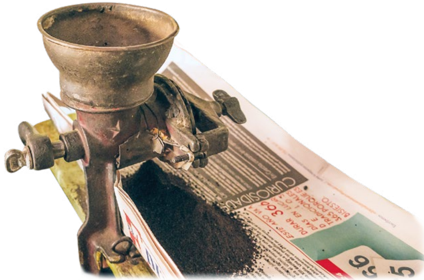
▲ Molinillo de café manual.