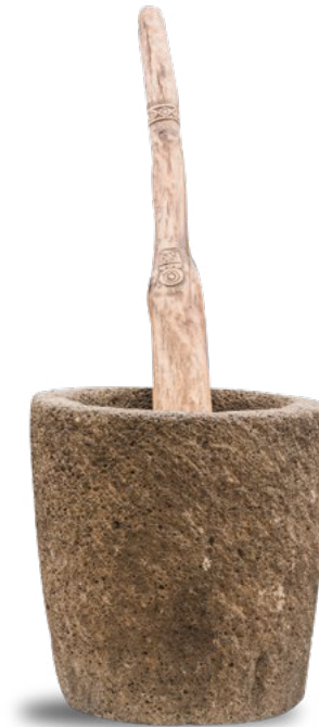
▲ Mortero de piedra para molienda de café.

cosecha, molienda, tostado y extracción, así como cafetos, granos de café, cribas, molinos, morteros, comales, cafeteras y diversos métodos de extracción.