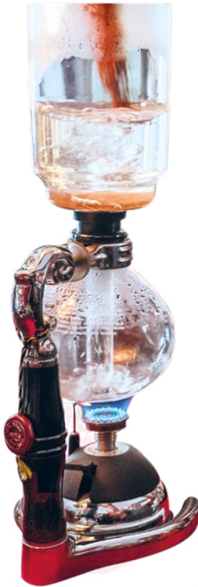
◀ Cafetera de sifón o de vacío.