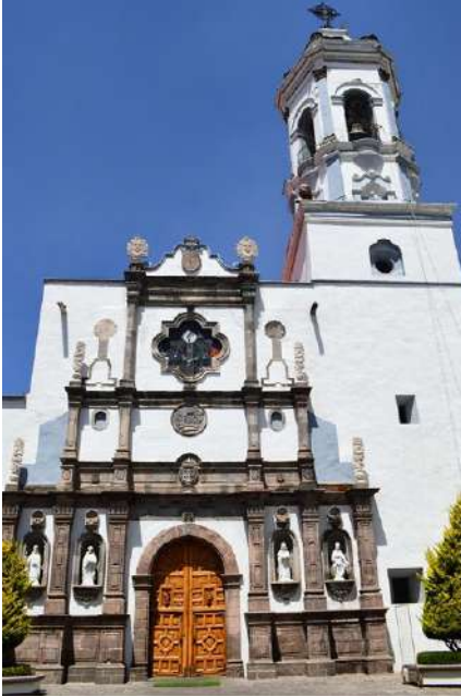
FOTOGRAFÍA 2.2. Fachada principal del templo de la Merced en Toluca.