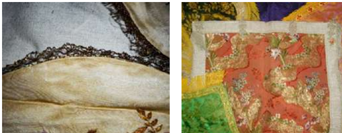
FOTOGRAFÍAS 3.5 y 3.6. Izquierda, Detalle de galón de plata. Derecha, capillos de capa pluvial, conservados en la parroquia de Santa Ana Tlapaltitlán.

Cabe resaltar la variedad de materiales que son descritos, al menos 58, entre los que podemos mencionar: madera de cedro, estopilla, oro, chamelote, encajes, piedra colorada, oro falso, plata, seda, latón, cobre, plumas, terciopelo, hoja de lata, sangalete, papel, cantera, granadillo, tela de Francia, hueso, concha, vidrio, tela encarnada, piedras encarnadas azules y verdes, capichola azul, nácar y carmesí, barro, tissu, ruan, piedra negra, mitán, glase, lampaso, galón (plata, dorado y oro), flecos de plata y oro, tecale, cotense, ayacaguite, tafetán, sala, piedra chicula, tela de china, estaño, tela de primavera, tela mexicana, razo liso, algodón, listón, ilustrina, razo de china, cambray, listón de lana, cotense florete y grisete.