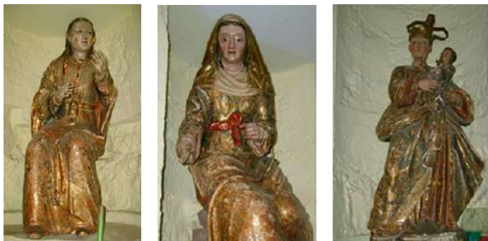
FOTOGRAFÍA 3.3. Ilustración de tres esculturas virreinales pertenecientes al pueblo de Santa Ana Tlapaltitlán, Toluca.