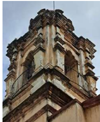
FOTOGRAFÍAS 3.1 y 3.2. Izquierda, Torre de la parroquia de Santa Ana Tlalpatitlán, Toluca. Derecha, Torre de la parroquia de San Sebastián, Toluca.

En cuanto al interior de los templos se vislumbra la existencia de más de 398 lienzos con las advocaciones locales veneradas en cada lugar, asimismo más de 170 santos tallados en madera y 48 crucifijos; elementos que dan cuenta de la gran producción y adquisición de arte en la zona.