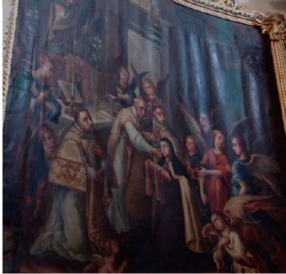
FOTOGRAFÍA 4.8. Santa Teresa recibiendo la Comunión.