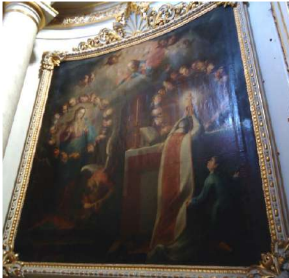
FOTOGRAFÍA 4.9. La Transubstanciación.

Características: Cartela que se lee en latín casi al centro, en la parte inferior del cuadro: Oveneranda sacerdotum dignitas, in quorum manibus. velutin vtero virginis. Tilivs del incarnatur dun auoustum Sup. Psalm. Marco de yeso que no es de época, sino acorde a la decoración actual de la capilla.