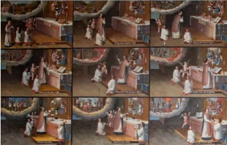
FOTOGRAFÍA 3.7. Detalles de pintura novohispana de momentos de la celebración de la misa, S. XVIII. Parroquia de San Felipe Tlalmimilolpan, Toluca.

El contenido de un inventario no sólo es un proceso de registro, sino que además contiene una serie de valorizaciones concretas sobre los elementos que en éste se enlistan. La selección y discriminación de determinados objetos o espacios da cuenta de las intenciones existentes detrás de quien o quienes lo elaboraron, los lugares de procedencia, su utilización y, además, las condiciones materiales que las influyen.