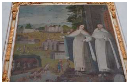
FOTOGRAFÍAS 6.8 y 6.9. Lienzo hispano. Lienzo del convento toluqueño.