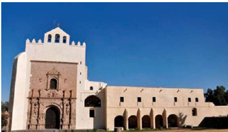
FOTOGRAFÍA 1.3. Convento agustino de Acolman.

de grandes dimensiones. Otro de los mejores ejemplos de la arquitectura del siglo xvi se tiene en el convento de Yanhuítlán, también en Oaxaca, que conserva la mayoría de sus retablos antiguos, lo que da una presencia unitaria de su estado original, resultado de los extensos trabajos de restauración. Caso contrario es el de la mayoría de los templos, parroquias y conventos que muestran las sucesivas modificaciones a lo largo de etapas que pretendieron modernizar según la moda de épocas posteriores, lo que significa que la mayoría de ellos no muestran sus expresiones originales, sino la superposición o sustitución de modelos anteriores. La mayoría de los templos fueron decorados con una mezcla de “elementos de los indígenas con los españoles, mientras que otros, como el del convento de Acolman tuvo una decoración más purista en términos del arte occidental, por ende, el convento es un espléndido ejemplar del arte del siglo xvi en la entidad” (Loera y Peniche, 2006: 45). Justamente, es el antiguo convento agustino de Acolman uno de los casos mejor conservado y restaurado, una de las mejores expresiones del plateresco.