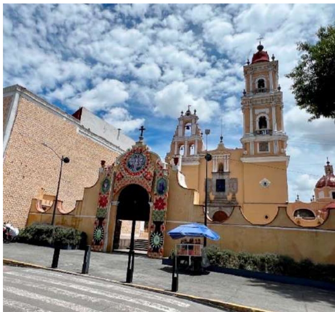
FOTOGRAFÍA 1.7. Conjunto conventual de El Carmen, Toluca, México.

Carlos Ledesma (2017: 93) expresa que: “probablemente el templo de San Martín Ocoyoacac sea el primer ejemplar neoclásico en el valle, asimismo, el templo de Santa Clara de Asís en Lerma