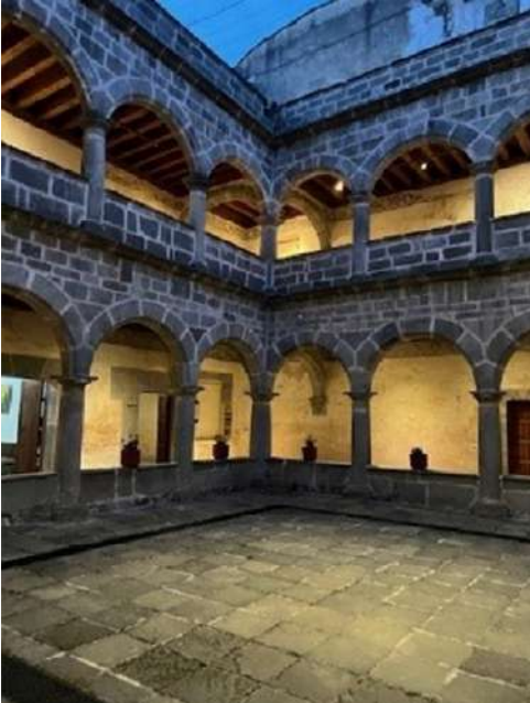
FOTOGRAFÍA 1.1. Claustro del convento franciscano de San Miguel Zinacantepec.

Estas actividades estaban encabezadas por el ritual de la misa, por lo que inicialmente se desplazó el altar principal de los templos conventuales hacia el exterior, los altares muchas veces fueron terminados después de las capillas abiertas. Las capillas abiertas fueron antecedidas por capillas de indios que “son una variante probablemente anterior a las abiertas. Eran (pues han desaparecido casi todas) unas grandes salas hipóstilas en las cuales, por sus dimensiones, se podían concentrar a cubierto verdaderas multitudes. Estaban totalmente abiertas también por un sólo lado, pero con mayor número de arcos” (Mendiola, 1993: 40).