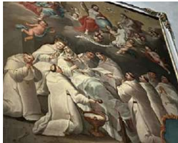
FOTOGRAFÍAS 6.5, 6.6 y 6.7. Lienzo del español Juan Luis Zambrano. Lienzo cuzqueño. Lienzo toluqueño.