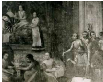
FOTOGRAFÍAS 6.24, 6.25 y 6.26. Lienzo hispano. Lienzo cuzqueño. Lienzo paradero desconocido del convento mercedario de Toluca.