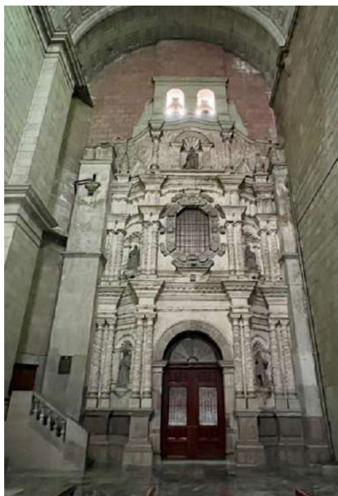
FOTOGRAFÍA 1.2. Fachada del templo del Sagrario en la Catedral.

Los bautisterios adquirieron gran relevancia dada la voluntad vehemente de bautizar masivamente a la población nativa y, con ello, dar cabida al vasallaje y a la práctica regular del cristianismo ante poblaciones indígenas que se contaban por millones. Esta actividad prioritaria durante la evangelización encuentra una de sus máximas expresiones en la gran pila bautismal monolítica del convento de Zinacantepec, cerca de Toluca, que simboliza todo el sincretismo del siglo xvi: la conjunción de elementos gráficos prehispánicos en convivencia con los del cristianismo europeo.