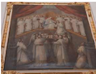
FOTOGRAFÍAS 6.17, 6.18 y 6.19. Lienzo hispano. Lienzo cuzqueño. Lienzo toluqueño.