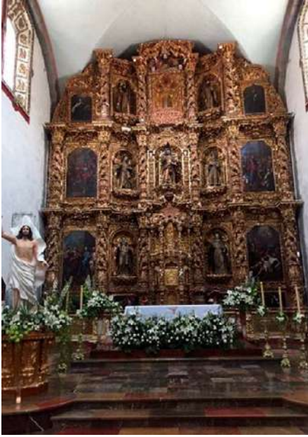
FOTOGRAFÍA 1.6. Retablo San Bartolomé Apóstol en Oztolotepec.

San Bartolomé Apóstol, en Oztolotepec, realizado dentro de un barroco exuberante de gran esplendor y que cuenta con gran significado teológico.