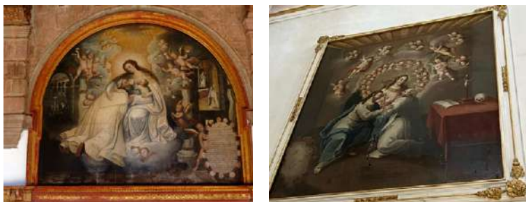
FOTOGRAFÍAS 6.3 y 6.4. Imagen del Luneto del convento cuzqueño. Imagen del convento toluqueño.

de una habitación donde se ve al santo postrado ante Jesús y María, quien está rodeado de ángeles y querubines; es anónimo, del siglo XVIII. Existe gran semejanza en los lienzos, aunque en el caso novohispano es Jesús adulto y contiene un halo de querubines, mientras que el cuzqueño agrega una vista al claustro. No existe ejemplo en el mundo hispánico, por lo que podría tratarse de un tema de los virreinos americanos.