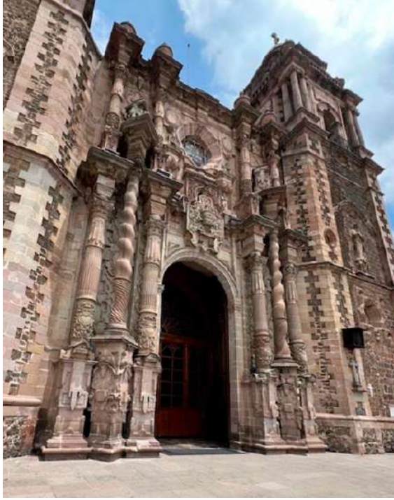
FOTOGRAFÍA 1.4. Templo de Santiago Apóstol en Tianguistenco.

Otro ejemplo de neóstilo en el valle de Toluca es el templo de la Merced. En su fachada se aprecian los elementos de esta modalidad: ensanchamiento de la calle principal, uso de líneas mixtas y empleo de pilastras. A continuación, se presenta una descripción de la importancia del clasicismo en la arquitectura novohispana a finales del siglo XVIII: