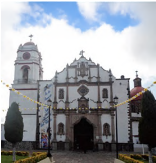
FOTOGRAFÍA 2.3. Fachada del templo de la Asunción de María de Tenango del Valle.

Resulta ser una fachada combinada, entre las pilastras y las columnas, pues las semicolumnas no están exentas, sin embargo, están organizada como si fueran pilastras.