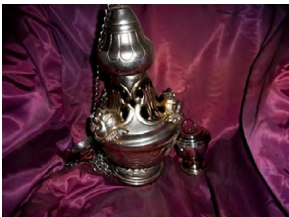
FOTOGRAFÍA 3.8. Incensario y naveta de plata, parroquia El Sagrario, Toluca.

El uso de plata en los utensilios litúrgicos, como los cálices de plata sobredorada documentados en el inventario, refleja no sólo la importancia que tenía el metal dentro de la economía novohispana sino también su importancia simbólica y funcional en la liturgia. Estos objetos, que destacan por su elaborada ornamentación, son ejemplos claros de cómo los recursos naturales se transforman en símbolos de divinidad y devoción, evidenciando la sofisticación de las técnicas metalúrgicas adaptadas para fines religiosos y artísticos, un fenómeno también observado por Gruzinski (1993) en su análisis de la negociación cultural en el arte colonial.