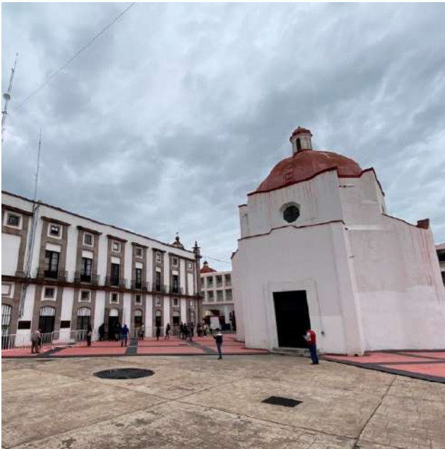
FOTOGRAFÍA 1.8. Conjunto conventual de la Asunción de María, su capilla de sacristía, Toluca.

En cuanto a la arquitectura doméstica, ésta fue cobrando mayor interés y se edificaron distintos ejemplos de mediados del siglo XIX que hoy perduran en el valle, como la Casa Número Dos, hoy museo de la Acuarela, la Casa de las Diligencias o la histórica Casa Díaz Gómez Tagle, que son eclécticas o neoclásicas. Igualmente, hay ejemplares de arquitectura pública en haciendas, ranchos o molinos.