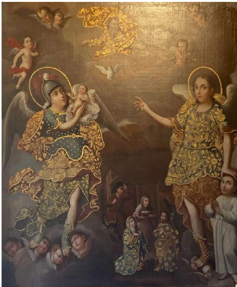
FOTOGRAFÍA 5.1. San Miguel Arcángel y el niño , óleo sobre tela, s. XVIII, Museo Virreinal de Zinacantepec, autor desconocido.