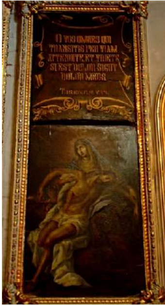
FOTOGRAFÍA 4.1. La Piedad. Acervo fotográfico de Carlos Ledesma (2024).

Iconografía: Representación tradicional de La Piedad, donde la Virgen María sostiene en sus brazos a Jesús muerto y descendido de la cruz; del lado superior izquierdo debajo de la leyenda se representa la tradicional daga que apunta al corazón de María, quien sufre por la muerte de su hijo. La composición de la pintura es triangular y sólo deja espacio para este par de personajes protagónicos.