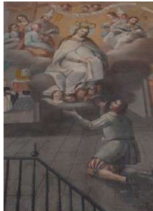
FOTOGRAFÍAS 6.10, 6.11, 6.12 y 6.13. Grabado del Memorial . Lienzo hispano. Lienzo cuzqueño. Lienzo toluqueño. Fuente: Zuriaga (2005: 301), Artnet (2025), ARCA (2025d) y Ruiz (2024: 144).