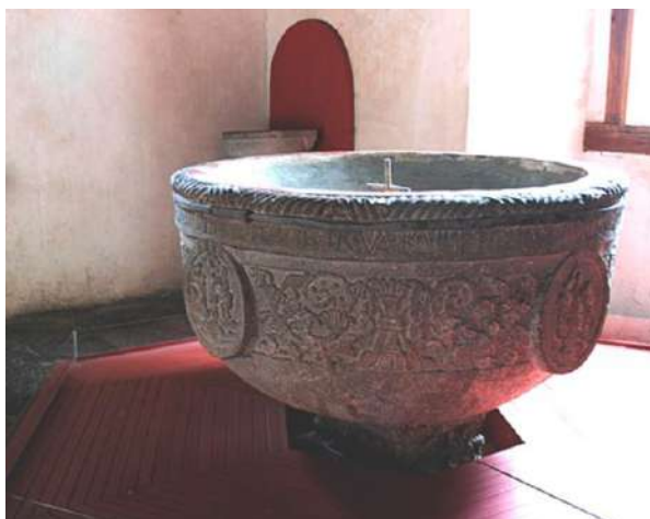
FOTOGRAFÍA 1.9. Pila bautismal del convento de San Miguel Zinacantepec.

Se ha aclarado que el neoclásico emerge sutilmente en los dos primeros siglos de la dominación y se manifiesta con mucha fuerza a fines del siglo XVIII y a lo largo del siglo XIX, casi por decreto real es, sin duda, el más oficial de los estilos y también coincide con la modernización de muchos templos en los que, en ocasiones, se destruyeron interiores y retablos anteriores. La figura señera del neoclásico en la Nueva España es sin duda Manuel Tolsá quien, por intermediación de la multitudada Academia de las Bellas Artes de San Carlos, implantó el neoclásico y su impronta queda expresada a plenitud en el Palacio de Minería y en la escultura ecuestre de Carlos IV.