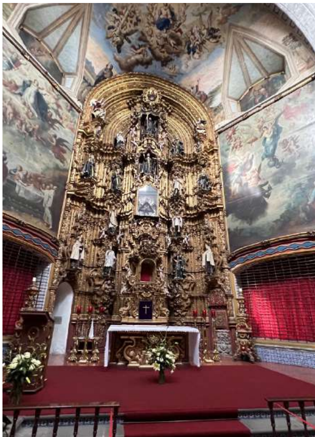
FOTOGRAFÍA C. Convento de la Enseñanza, Ciudad de México.

Finalmente, esta imagen refleja el esplendor del barroco exuberante del siglo XVIII, se trata del templo conventual femenino de la Enseñanza de la Ciudad de México.