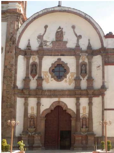
FOTOGRAFÍA 2.4. Fachada del templo de Santa María Magdalena.