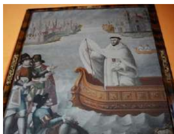
FOTOGRAFÍAS 6.20, 6.21, 6.22 y 6.23. Grabado del Memorial . Lienzo hispano. Lienzo cuzqueño. Lienzo toluqueño. Fuente: Zuriaga (2005: 777) Fundación universitaria española (2025c), PESSCA (2009) y Ruiz (2024: 144).