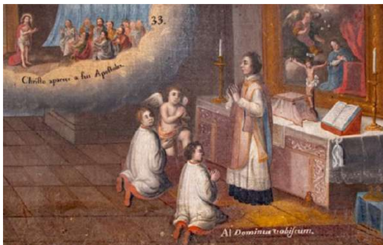
FOTOGRAFÍA 3.9. Detalles de pintura novohispana de momentos de la celebración de la misa, s. XVIII. Parroquia de San Felipe Tlalmimilolpan, Toluca.

El inventario de bienes religiosos de los pueblos pertenecientes al convento de Toluca, al ser analizado en profundidad, ofrece una valiosa oportunidad para entender no sólo los objetos en sí, sino también los contextos sociohistóricos y culturales que les dieron forma y significado. Al tratar estos inventarios no únicamente como listas empíricas, sino como textos narrativos y multivalentes, se puede desentrañar cómo estos documentos funcionan como elementos en la creación de una geografía artística puntual (Riello, 2013: 135-137).