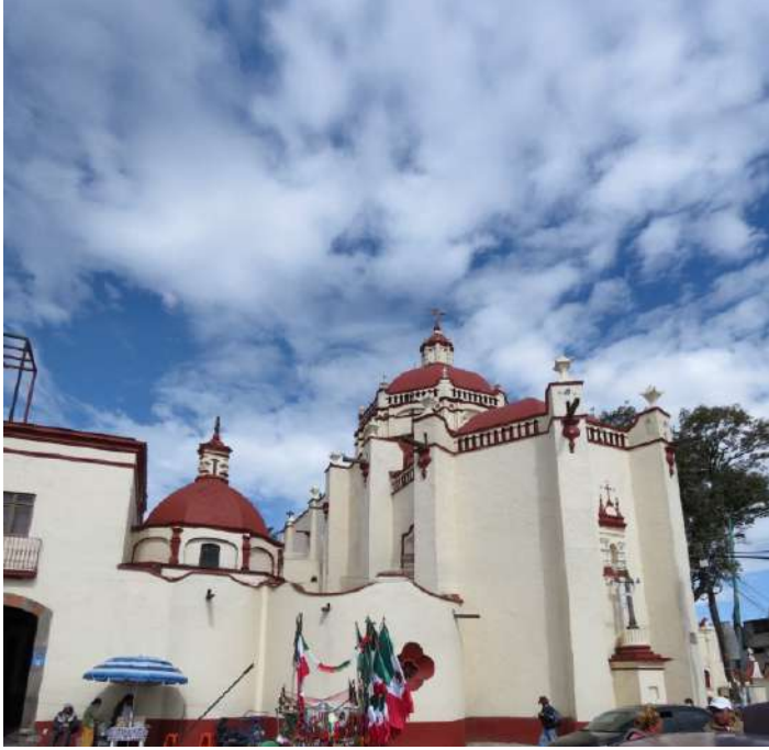
FOTOGRAFÍA 1.10. Templo de Capultitlán, municipio de Toluca.