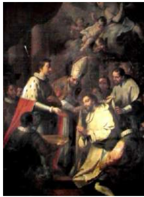
FOTOGRAFÍAS 6.14, 6.15 y 6.16. Lienzo cuzqueño. Lienzo toluqueño. Lienzo hispano.

mismo convento. La obra novohispana se halla en la parte alta del muro derecho de la nave principal, fue realizada por Pedro José de Rojas en 1795. En las tres pinturas fue importante presentar a los tres fundadores y el aspecto arquitectónico de la Catedral de Barcelona.