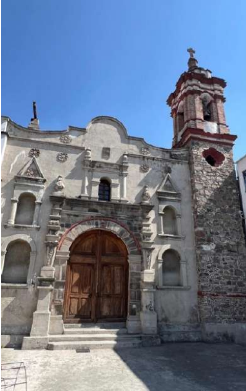
FOTOGRAFÍA 2.1. Fachada del templo de San Juan Evangelista (chiquito) en Toluca.

En suma, como lo indican Melgoza y Ledesma (2022: 73), en un primer momento, la recargada decoración de templos como el juanino en Toluca o la parroquia de San Antonio la Isla que datan de principios del siglo XVIII se fueron transformando a mediados de aquel siglo y se procuró un mayor equilibrio en el uso de las formas, reflejado en templos de la segunda mitad de dicha centuria.