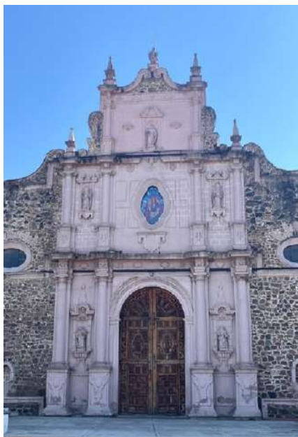
FOTOGRAFÍA 2.6. Fachada del templo de San Bartolomé Apóstol.

Como sucedió con el templo de San Juan Bautista en Metepec, “el convento agustino de Capulhuac pasó a manos seculares durante el siglo XVIII” (Parroquias, arquidiócesis de Toluca, 2022: 51-55). Su fachada contiene como elemento principal columnas, semiexentas, su calle principal se ensancha, emplea roleos y volutas en el remate de la fachada. Se ocupan las peanas nicho y contiene un óculo lobulado ovalado, otro elemento regional. Asimismo, emplea guardamalletas en las basas de las columnas, en semejanza al templo de Santiago Tianguistenco.