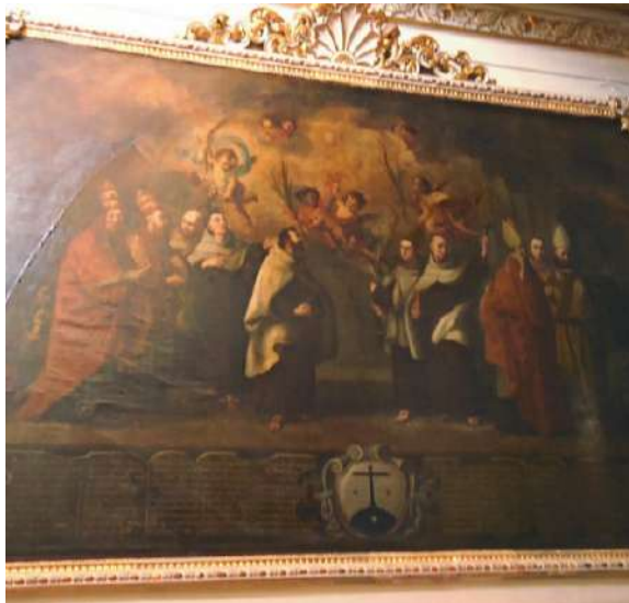
FOTOGRAFÍA 4.3. Santos Carmelitas.

El marco es de yeso y no corresponde a la época, sino a la decoración actual de la capilla.