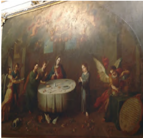
FOTOGRAFÍA 4.4. La Sagrada Familia.