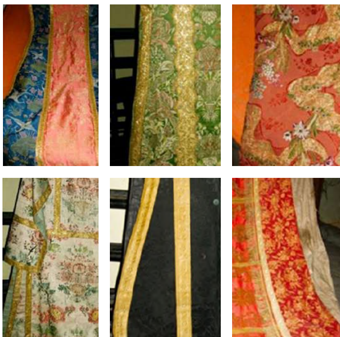
FOTOGRAFÍAS 3.4. Detalles de casullas y dalmáticas novohispanas resguardadas en la parroquia de Santa Ana Tlapaltitlán, Toluca.