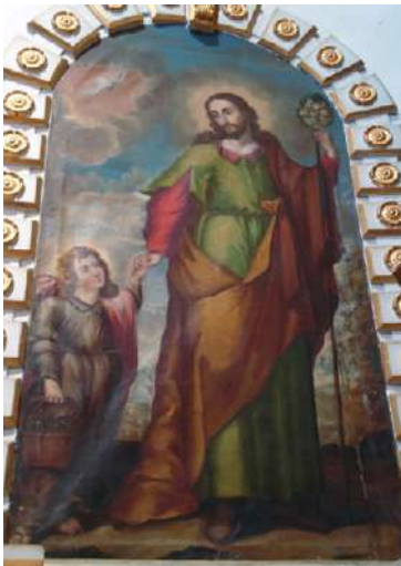
FOTOGRAFÍA 4.6. San José y el niño Jesús.

En esta sencilla composición vertical vemos a san José representado como varón adulto, joven, barbado y de cabello largo, pudiera confundirse con la imagen de Jesús, sin embargo, su vestimenta color verde y su vara florida permiten establecer con claridad su advocación (Schenone, 1992: 491). El infante Jesús lleva sus herramientas como un hijo obediente que enfatiza la naturaleza humana de ambos personajes y el vínculo filial y de cariño; aunque la presencia del Espíritu Santo establece con claridad el origen divino del pequeño. La dulzura de los rostros acerca a los fieles a la devoción de estos personajes que ocupan casi la totalidad del lienzo. La composición se completa con un escueto paisaje donde apenas se distingue