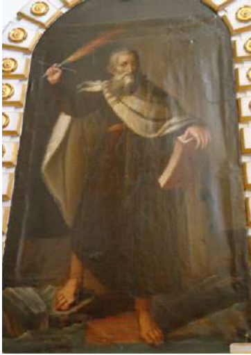
FOTOGRAFÍA 4.7. Profeta Elías.

que no es de la época, sino correspondiente a la decoración actual de la capilla.