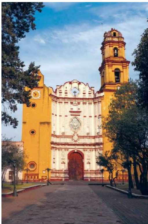
FOTOGRAFÍA 2.5. Fachada del templo de San Juan Bautista en Metepec.