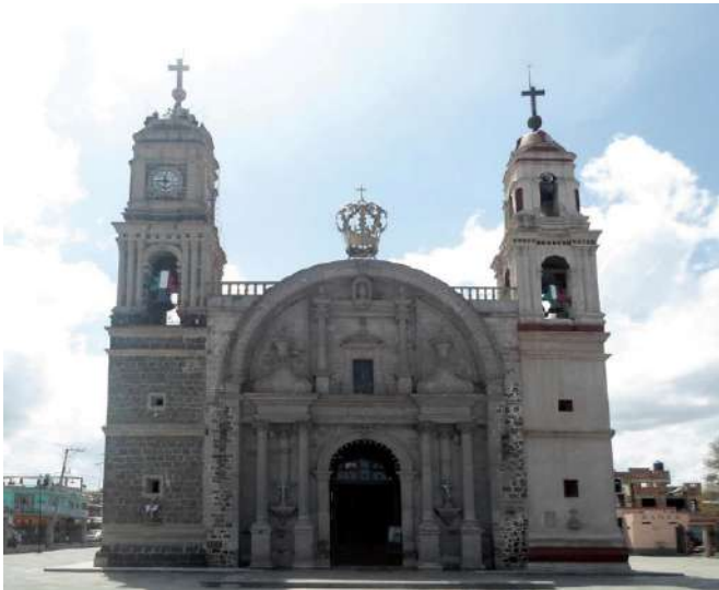
FOTOGRAFÍA 2.7. Fachada del templo de Nuestra Señora de Guadalupe.

El templo, como lo señala Ledesma “fue construido en 1679 y su posible consagración en 1725 empero, la portada de este templo guadalupano podría ubicarse por sus aspectos formales a finales del siglo XVIII y principios del XIX, aunque como se ha indicado, algunos elementos se encuentran en transición al neoclásico” (2017: 79). En la fachada del templo se aprecian ciertos elementos de la modalidad como cuatro columnas exentas de capital compuestas en el primer cuerpo, y dos de menores proporciones en el segundo. Emplea líneas mixtas en los remates de las columnas del primer cuerpo y dos florones. Igualmente, se emplean peanas-nicho en el primer cuerpo, peculiares por ser muy largas.