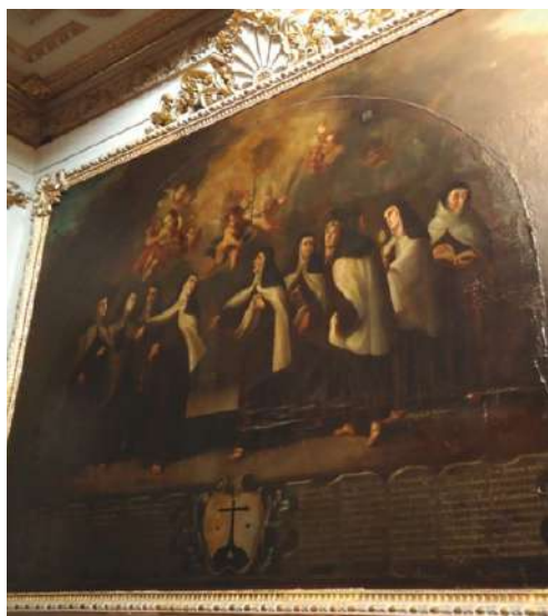
FOTOGRAFÍA 4.2. Santas Carmelitas.