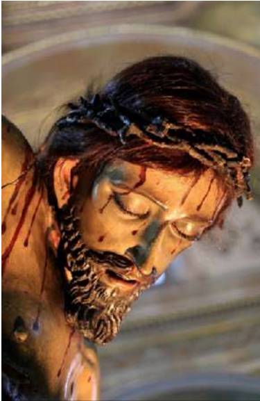
FOTOGRAFÍA 3.10. Cristo tallado en madera, S. XVIII, detalle. Parroquia de San José El Sagrario, Toluca.

de registrar la posesión de bienes, articula la identidad y las aspiraciones de las comunidades que lo elaboraron. Por ejemplo, la inclusión detallada de objetos de lujo como los ornamentos de plata y los tejidos importados refleja un esfuerzo por mostrar devoción y estatus, proyectando una imagen de riqueza y conexión con redes más amplias.