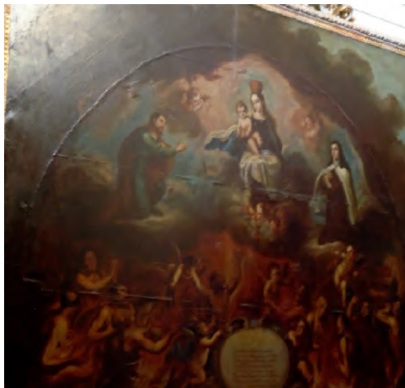
FOTOGRAFÍA 4.5. Virgen del Carmen y las almas del Purgatorio.