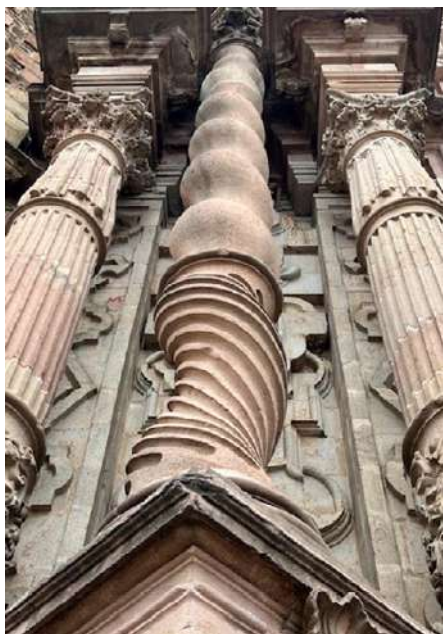
FOTOGRAFÍA 1.5. Detalle del neóstilo del templo de Santiago Apóstol en Tianguistenco.

de San Carlos de la Ciudad de México. Los arquitectos novohispanos también basaron sus creaciones en la aplicación de las consideraciones registradas en los tratados de arquitectura y propias de la herencia clásica, aplicándolas a su manera en diferentes edificios del valle de Toluca (Ledesma y Olivares, 2018: 2).