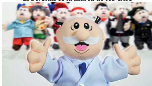
Imagen 1. El Dr. Simi es la marca de los CAFs