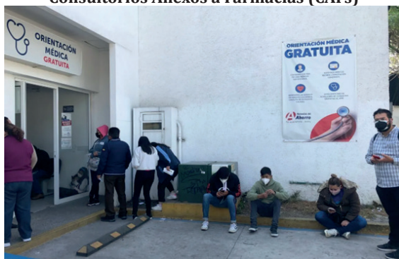
Imagen 3. Consultorios Anexos a Farmacias (CAFs)

Este escenario se dibuja un territorio en salud, el cual se ha desarrollado ante un saturado sistema de salud mexicano, donde los servicios de acceso son limitados, y donde millones de mexicanos siguen y seguirán acudiendo en grupos a este nuevo modelo mercantil, los CAFs son un territorio de oportunidad empresarial en salud , que brinda una respuesta sublime a una necesidad de índole nacional, donde la economía política del liberalismo , se muestran como parte de la premisa en la búsqueda de la salud y los canales fundamentales para satisfacer las necesidades de un individuo son el mercado privado.