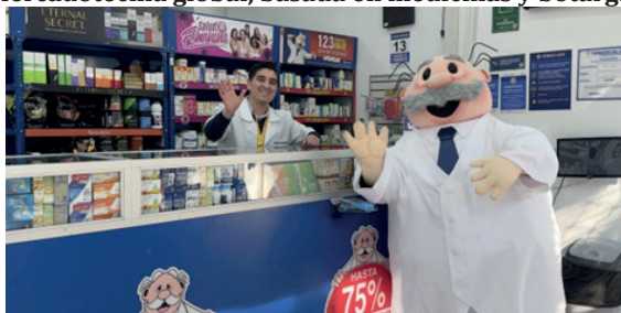
Imagen 4. Mercadotecnia global, basada en medicinas y botargas

un embajador de marca asociado a Farmacias Similares, este personaje se muestra con un aspecto físico que es gracioso, generoso, amable, pacífico y ahora se personifica en todo acto cultural mexicano — conciertos de música, partidos de futbol, luchas libres, entre otros, hace su aparición personificado con atuendos de rockero, taquero, músico —, este personaje ahora ha sido obsequiado a los artistas extranjeros y nacionales como muestra de reconocimiento a su trayectoria. Esta estrategia de marketing en salud fue orgánica, lo que da como resultado apropiación social, prestigio y reproducción, un Top of mind que fue incrustado en el imaginario de los colectivos.