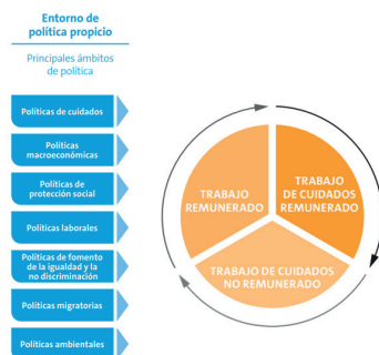
Figura 4. Políticas públicas para el cuidado