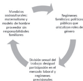
Figura 3. Componentes de la organización social de los cuidados: dimensión sociocultural, política y económica