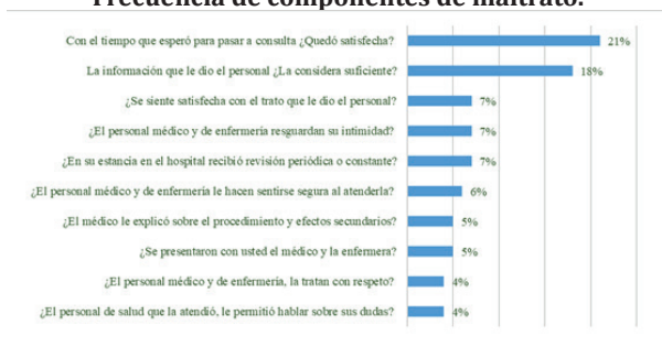
Gráfico 3. Frecuencia de componentes de maltrato.

Las áreas del Hospital donde las embarazadas percibieron maltrato fueron admisión, toco cirugía, labor, con menor frecuencia en hospitalización, recuperación, expulsión y quirófano. Las empleadas administrativas de admisión fueron quienes frecuentemente daban mala cara, les negaban la atención y eran apáticas. El concentrado de respuestas para identificar el “concepto respeto” de las embarazadas se ve en el gráfico 4.