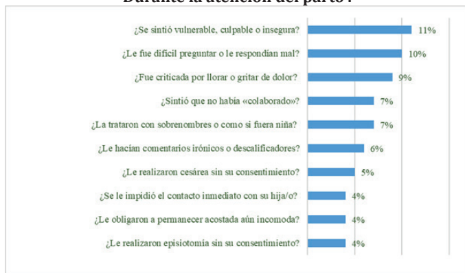
Gráfico 2. Frecuencia de componentes de violencia obstétrica. Durante la atención del parto .

El gráfico 2 muestra los 10 ítems con respuesta “sí” que ocurrieron con mayor frecuencia.