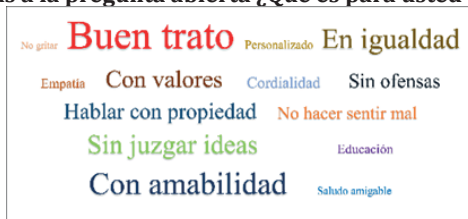
Gráfico 4. Respuestas a la pregunta abierta ¿Qué es para usted el respeto?

La percepción de maltrato y violencia obstétrica incrementó entre aquellas mujeres con edad mayor de 30 años, con escolaridad bachillerato o superior, que acudieron en turno nocturno o fin de semana, las que tenían cesárea programada, y las que al final de la entrevista hicieron sugerencias para mejorar el trato en la atención a la salud. Entre tales sugerencias destacan: capacitar a las asistentes de la recepción, vigilar la atención de enfermería, ofrecer orientación, contar con más personal de salud, disminuir trámites burocráticos, que el personal muestre paciencia y tolerancia, capacitar al personal en calidad y en comunicación, supervisar al turno nocturno y a los vigilantes, contar con recursos materiales suficientes.