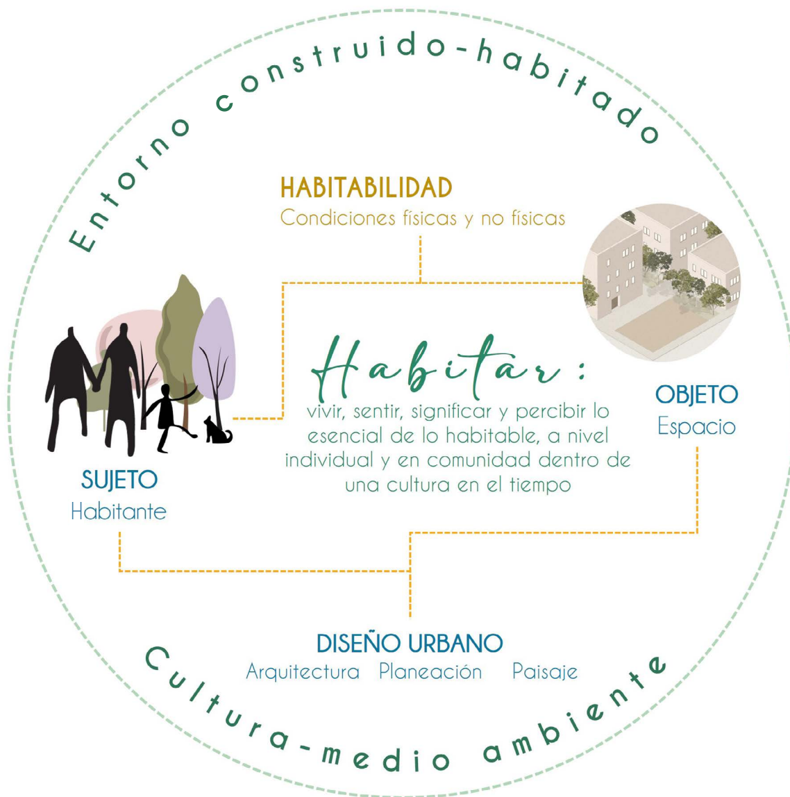
Figura 1. Habitar: interfaz sujeto-objeto, habitabilidad-diseño urbano, entorno construido-habitado-cultura y medio ambiente

Fuente: elaboración propia (2023). © Copyright