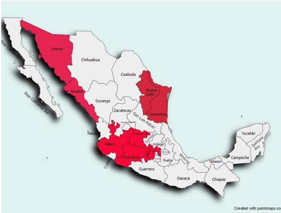
Gráfico de zonas donde las desapariciones forzadas se encuentran en un punto culminante