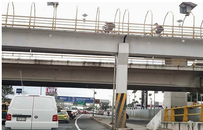
Figura 3. Intersección de la avenida López Portillo y la vialidad Alfredo del Mazo