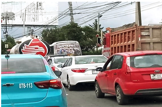
Figura 2. Avenida López Portillo