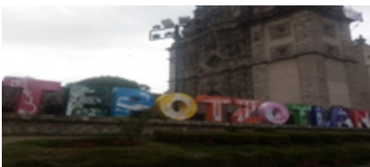
Cabecera Municipal de Tepetzotlán, 2023, Plaza Principal.

En este orden de ideas, figuran los siguientes atractivos que los turistas y excursionistas pueden disfrutar en Tepetzotlán, a saber: su Centro Histórico (donde se encuentran el Palacio Municipal, la Plaza de las Artesanías, el Mercado Municipal, la Plaza de la Cruz), los Arcos del sitio o Acueducto de Xalpa (de importante productividad durante los siglos XVII, XVIII y mediados del XIX), la Cañada de Cisneros, el Ex Convento de San Francisco Javier, la Iglesia de San Francisco Javier, la Iglesia de San Pedro Apóstol (destaca por el arco triunfal del atrio), el Museo Nacional del Virreinato (antes ex Colegio Jesuita de San Francisco Javier y en el que se exhibe una colección de arte pictórico, cultural, religioso, civil y militar del periodo colonial), el Parque Estatal Sierra de Tepetzotlán, el Parque Xochitla (70 ha de áreas verdes donde se ofertan servicios relacionados con la preservación del medio ambiente), tal como lo cita Mendiola, I. (2015, pp. 27-32). Del mismo modo, figuran festividades diversas, tales como la del Señor del Nicho, San Pedro y San Pablo, además de las pastorelas decem-