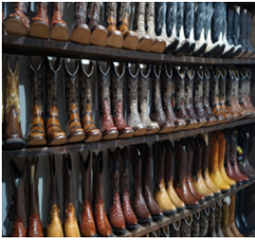
botas tradicionales.

fin, magia que te emanan en cada una de sus manifestaciones socioculturales, y que significan hoy día una gran oportunidad para el aprovechamiento turístico. El Programa Pueblos Mágicos contribuye a revalorar a un conjunto de poblaciones del país que siempre han estado en el imagina-