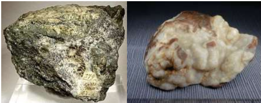
Plata nativa con oro y Calcedonia, minerales del Laboratorio de Química Biológica y fotografías de Sergio Arturo Salazar Maya de Servicios Externos de la Facultad de Química, UAEM.