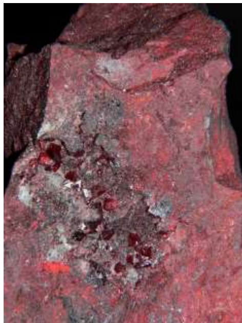
Mineral “Cinabrio” del Laboratorio de Química Biológica y fotografía de Sergio Arturo Salazar Maya de Servicios Externos de la Facultad de Química, UAEM.