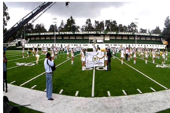
A la izquierda instrumentistas en estudio de grabación; a la derecha, filmación del video “yo soy mexiquense” (Anaya, 2014. Imágenes del archivo del plantel).