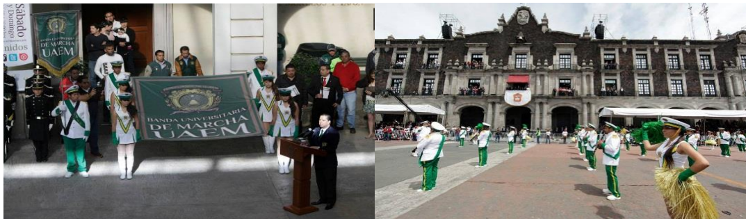
A la izquierda ceremonia de abanderamiento de la banda; a la derecha, desfile cívico en Toluca (Anaya, 2014. Imágenes archivo del plantel).

Días más tarde, en la ceremonia del 16 de septiembre, se institucionaliza la ceremonia de abanderamiento de la banda y participa en el desfile de independencia, en la ciudad de Toluca.