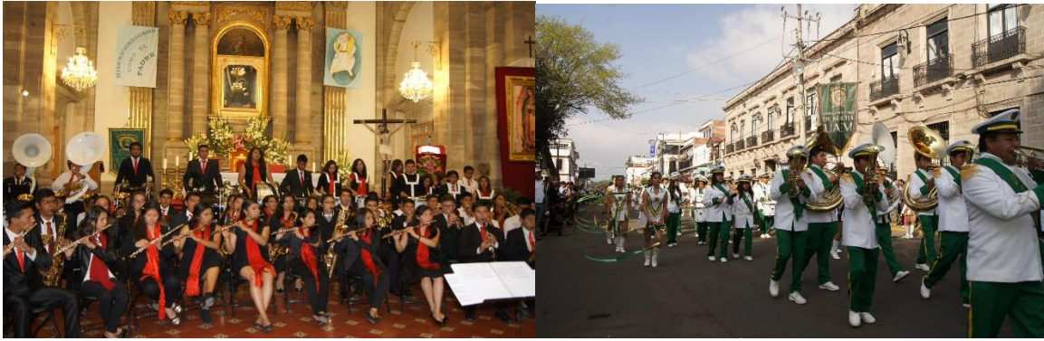
A la izquierda concierto navideño en la catedral de "San Clemente", a la derecha, desfile de 20 de noviembre, ambos en Tenancingo (Anaya, 2015. Archivo del plantel).

Sin lugar a dudas, la banda universitaria de marcha ha venido a proyectar la imagen del plantel, esto a nivel local, como a nivel universidad, que junto con la categoría uno del SNB, han contribuido a ser un mejor plantel y un mejor Nivel Medio Superior de la UAEMéx.