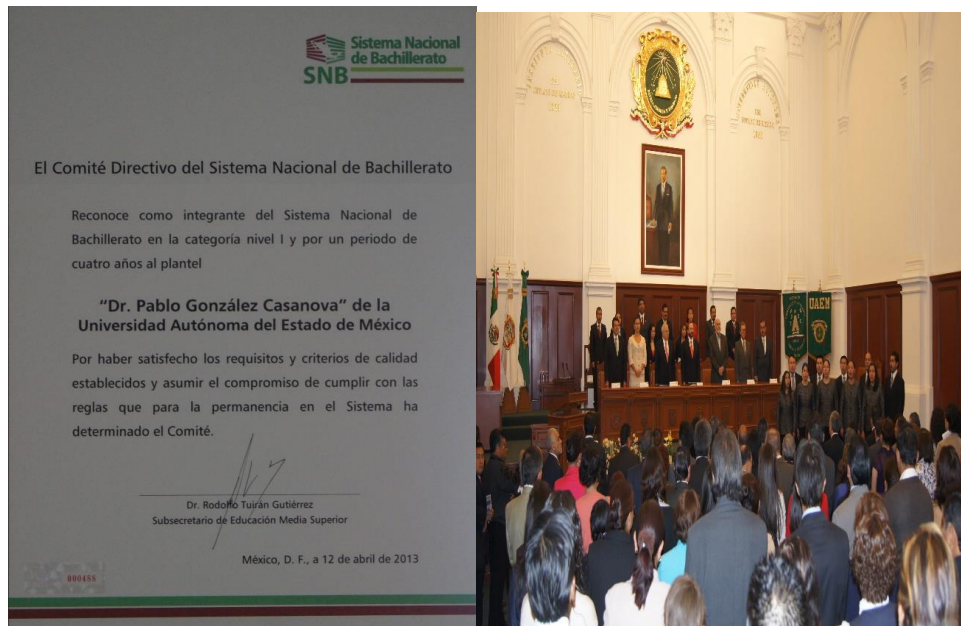
A la derecha copia del acta de ingreso al nivel uno del SNB; a la derecha, ceremonia de entrega de acta, en la sala “Adolfo López Mateos”.

Ante la preguntas de ¿cómo se ha visto reflejado, en la comunidad del plantel, el ostentar la categoría uno dentro del SNB? La respuesta sería en varios aspectos, ya que en los últimos tres años se han obtenido importantes logros, en olimpiadas nacionales y estatales, sin olvidar los múltiples logros tanto en lo deportivo y en lo académico a nivel interprepas, de la universidad. Si bien, se reconoce que el sólo hecho de tener una clasificación del SNB no constituye nada, sino se trabaja en función de dignificar la categoría. Bajo ese postulado, entonces, es que el plantel ha trabajado, es necesario resaltar que el trabajo ha sido arduo y que ha involucrado a cada uno de los elementos que trabajan y que estudian en él. En 2017 se hará una visita más de COPEMS, que evaluará al plantel, con el objetivo de mantener la categoría uno del SNB.